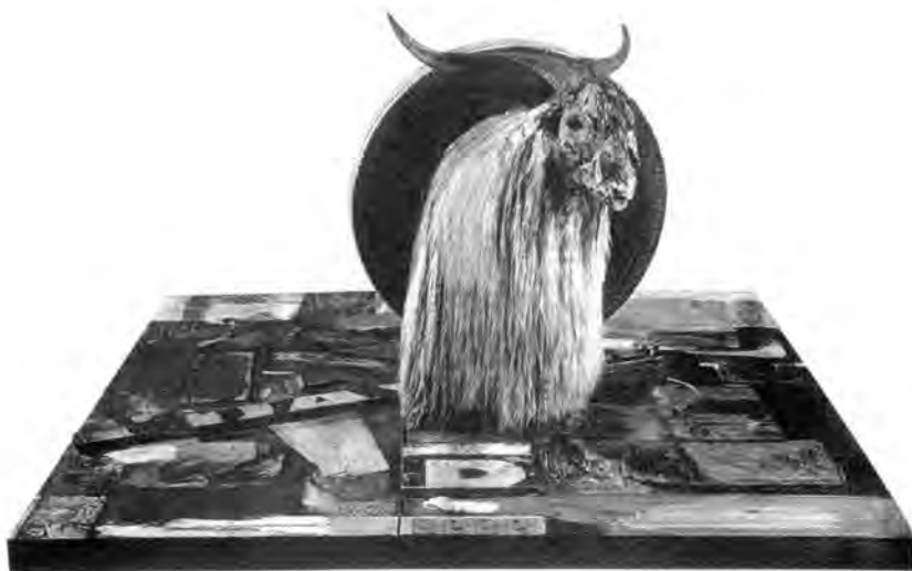
Robert Rauschenberg: Monogram , 1955 - 1959