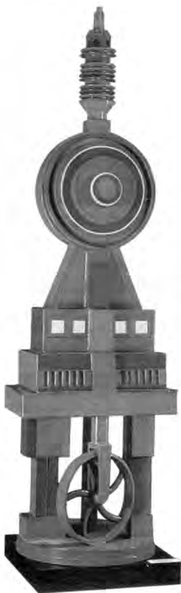
Eduardo Paolozzi: Poslední idol, 1963

formovaných lidských těl a odindividualizovaných figur – morální propad a odcizenost člověka v epoše přemnožené a bezcitné společnosti.