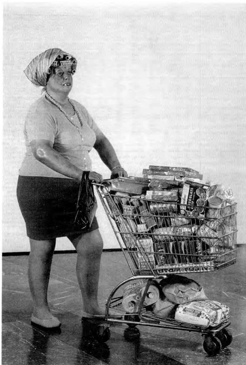
Duane Hanson: Žena s nákupním vozíkem, 1969