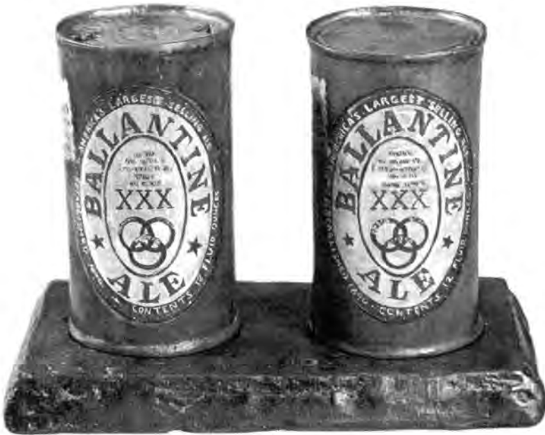
J. Johns: Pomalované bronzy II, 1964

Musical box (Hudební skříňky, 1951). Poté vznikaly skříňky a objekty, kameny, kosti a dřívka v dřevěných skříňkách, dále přírodní obrazy, kusy země, z nichž vyrůstaly rostliny a plastické objekty, červené obrazy (nalepené útržky novin a textilií přemalované červenou barvou). Kombinovaná malba využívá nejrůznějších předmětů moderní civilizace, částí strojů, reprodukcí z módních časopisů, fotografií i klasických reprodukcí, a rozvíjí tak techniku asambláže, což je trojrozměrně sestavené výtvarné dílo z nejrůznějších předmětů. Tento Rauschenbergův styl bývá někdy označován také jako neodadaismus. Rauschenberg se ovšem později od vlivu dadaistů oprostil a dospěl k originální syntéze gestické malby, informelu a dadaismu. Lze říci, že jeho práce představují spojovací článek mezi poválečnými formami abstrakce a pop-artem. Některé combine paintings se později rozvíjely až do tvarů prostorových kompozic, tzv. environments, např. Black Market (Černý trh, 1961). Podle Rauschenberga měl být pop-art projevem vyplňujícím propast mezi uměním a životem, projevem, který měl být bezprostředním výrazem reálnosti.