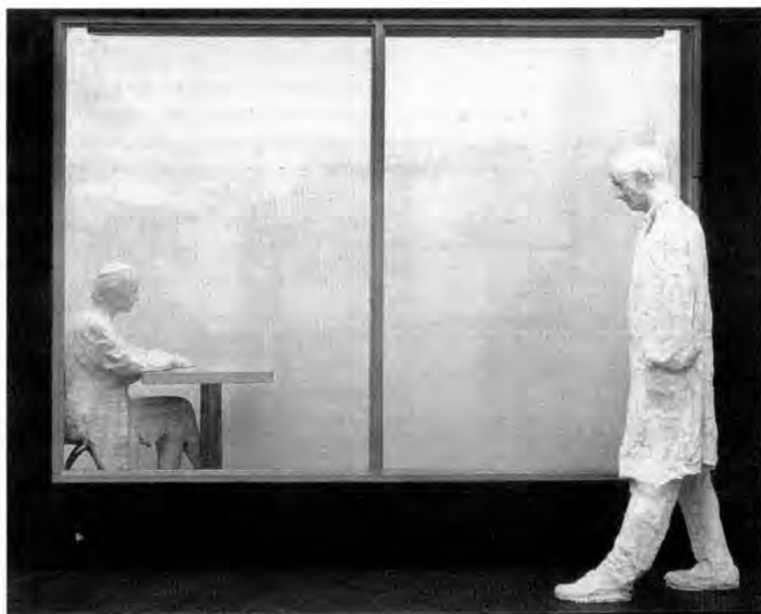
G. Segal: Okno restaurace, 1967

ING STATION“ a figurou strýčka Sama. Následuje skupina vojáků v naturalisticky provedených mundúrech s přilbami na hlavách, pod nimiž nikdo není, a proto pod nimi může být každý. Za nimi je umístěna černá náhrobní deska, na kterou mohl kdokoliv napsat přiloženou křídou datum a místo jakéhokoliv nového a draze vykoupeného vítězství. Přenosný pomník válečníků, který by mohl být mementem všech válek, je také politickým komplexem. Vlevo začíná propagandistické klíše: hliněnou figurou zpívající oddílové ošetřovatelky Kate Smithové, která neustále vřeští „God bless America“, pak následuje Uncle Sam na povolávacím rozkazu; slavné, pro fotografii postavené vztyčení praporu s hvězdami na hoře Suribachi, s vojáky ve skutečných uniformách, náhrobním kamenem se jmény 465 ve válkách zničenými zeměmi. Vpravo bar s trubkovým nábytkem, business as usual, Coca-Cola-Imperialismus. Že to vše spolu souvisí, ukazují vojáci, kteří vztyčují svůj prapor nad převrácenou trubkovou židli, ignorující kavárenský stůl. Víceúčelový válečný památník jako protiválečný monument.