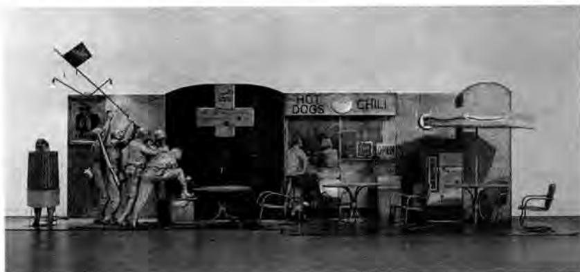
Edward Kienholz: Přenosný pomník válečníků, 1968

Jinou strategii vedle „zženštilosti“ je jejich zvětšování do monumentality. Vtip spočívá v kontrastu mezi velebností pomníku a banální věcí. Ve světě, ve kterém může být na obrazovce všechno malé a na plátně kina všechno velké, jsou míry tak jako tak vzrušující. Z toho Oldenburg současně vytěží účinek geometrie vzdálenosti. Až do roku 1969 pouze kreslil: jako dům vysoké zdi pro Stockholm, ventilátor ve tvaru banánu pro Times Square, pomník ve tvaru nůžek, který měl nahradit ve Washingtonu obelisk. Teprve v roce 1969 došlo k první realizaci: u příležitosti vyvrcholení studentských protestů proti válce ve Vietnamu umístil na Yale University v podobě falické osm metrů vysokou rtěnku nad raketometry, která odsuzovala válku jako feministicky plížící se masochistickou erekci, jako kolaps (původně nafouklé) obelstěné pacifistické rtěnky, což bylo jen otázkou času. V roce 1971 padly Oldenburgovi do očí ve výstavním parku v Sonsbeeku četné stavební jámy nedokončených domů, plné vody a rybník s labutěmi. A tak zde nechal vyrůst ze země 12 metrů vysokou zednickou lžici, jejíž prohnutí držadla připomíná labutí krk. Poté realizoval více monumentů. Ty patří svým precizním vztahem k místu, svým ikonografickým espretem a svou důvěrností formy k řídké šťastným novotám ve veřejných prostorech.