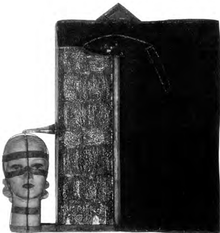
Edward Kienholz: Temnota noci , 1962

úpravy. Mezi kartonovými modely a těmito kovově černými, porcelánově bílými nebo dekorativně barevnými a lesklými konečnými verzemi ve vinylu existují většinou ještě vybledlé látky v přírodních barvách plachtoviny, které Oldenburg srovnával s duchy.