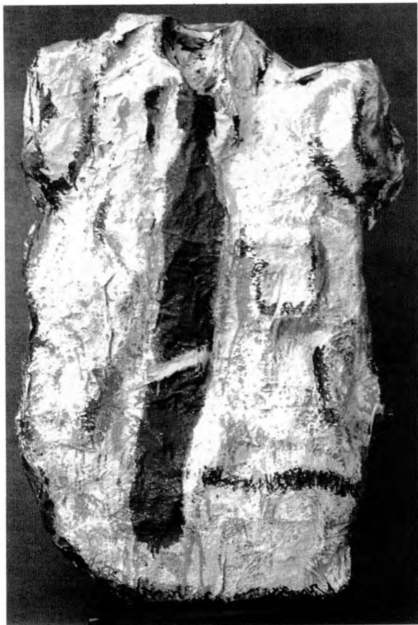
Claes Oldenburg: Bílá košile s modrou kravatou, 1961