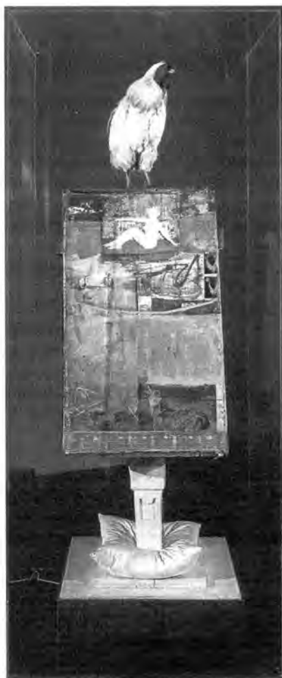
Robert Rauschenberg: Odaliska , 1955 - 1958

Tito umělci současné Ameriky se dostávali často do blízkosti pop-artu. Vybírali si město v jeho vitální opotřebenosti, brutalitě a ztrátě komunikativnosti. Na druhé straně pop-art vidí ono městské ve folkloru křiklavých mediálních obrazů a atraktivně zabaleného světa zboží. Nic není dosti špinavé, všechno je připravené ke konzumu. Do plastiky pronikají vmontované výrobky Jima Dinese, celofánové fólie Jamese Rosenquista, krabice Brillo Andy Warhola ja-