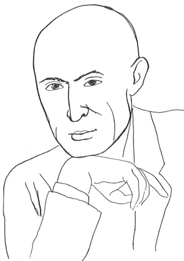
Portrét Vladislava Vančury od Františka Muziky