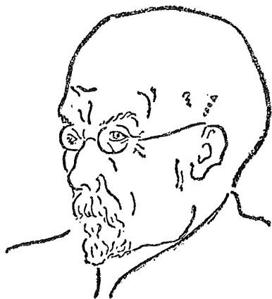
Portrét Otokara Březiny od Karla Čapka

a uhasíná v strachu // Je bez nástupce král jak by se posel bral / a těžce vrávo- ral stín koně smrti kluše / v korunovační sál kde jak by duhou hrál / se vznáší svatý Grál z hvězd básnickovy duše.“ Je nutno dodat, že o této básni se zmiňuje mimo jiné František Hrubín ve své vzpomínkové knížce Lásky (1967), je- jíž březinovskou kapitolu pojmenoval právě Nezvalovými slovy: Je bez ná- stupce král.