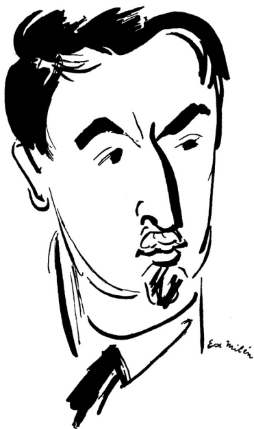
Portrét Jiřího Mahena od Eduarda Miléna

jeho přátelé visí prapory / On to ví a neví upíraje oči na stěp plané růže / Již zvedl cestou a za nic nevymění / V zemi kde je básníkem aniž to tušil / Básníkem několika zázračných vět a prázdného pokoje s jedi- ným klíčem / On to ví a neví v jakési márnici ozdobené vlajícími kapesníky / V márnici kde se rozednívá prsten na mi- losrdných rukou žen / Prsten svobody pro niž zas hlasitě zaznívá píseň...“