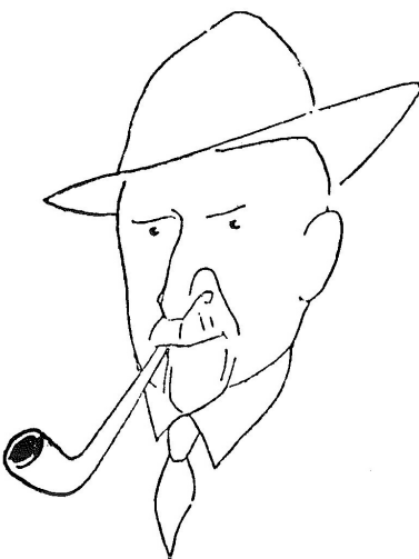
Portrét S. K. Neumanna od Adolfa Hoffmeistera