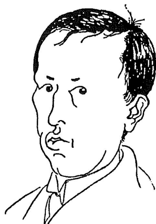
Autoportrét Karla Čapka

Mahena a zařazenou do sbírky Pět minut za městem (1940). Evokuje v ní jednu silvestrovskou oslavu za Mahenovy účasti, přičemž popisuje i jeho vzhled. Mluví o něm jako o muži, „který podruhé už sotva narodí se“, který „kráčel věčně do pekel a s nebem se rval“ a stal se „obětí melancholie“. Nezval vzpomíná na chvíle společně prožité v Brně a Praze, jež líčí po způsobu Apollinairova Pásma a s využitím četných asociací a anafor. Glosuje těžkou dobu a situaci, kdy se člověku svět promění v „trýznivé vězení“, takže nechce „vůbec žítí“. Své rozloučení, korespondující s Halasovou básní Smrt Jiřího Mahena ( Ladění , 1942), Nezval uzavírá s částeč-