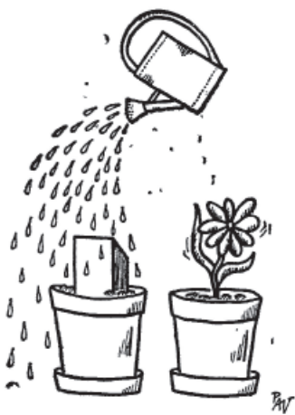
Kresba Miroslava Pavlíka

Ilustrace Miroslava Pavlíka z Universitas čís. 4, 1975, str. 54 a 96