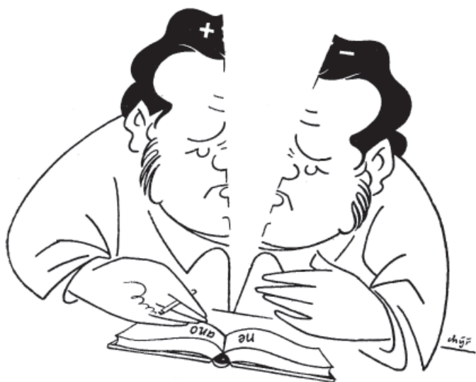
Rozpolcenost osobnosti, kresba Rudolfa Puchýře