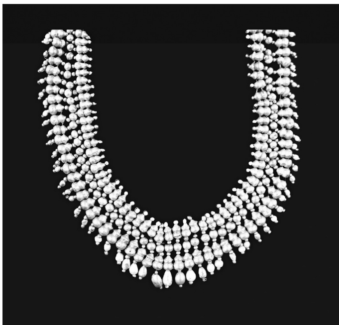
Část několikařadého náhrdelníku ze zlatých korálů, ozvláštněného pravými perlami po obou okrajích. Jde o říční perly, jen několik velkých perel uprostřed je mořského původu (Peru, severní pobřeží, Lambayeque-Sicán, 700–1100 n. l., Mus. Oro).

Zvonovité obřadní poháry (keros) z drahých kovů, ale také z keramiky nebo ze dřeva, které sloužily k rituálním účelům (obětním úlitbám bohům), nalézáme nejen v kultuře Lambayeque, ale v mnoha dalších peruánských kulturách. Materiál, z něhož byly zhotoveny, prozrazoval postavení jejich majitele. Zlatý obřadní pohár (kero), na němž jsou znázorněny tepané postavy Naymlapa s půlkruhovou péřovou čelenkou, držící v každé ruce hůl, patří do této kategorie. Hojné chryzokolové vložky jsou umístěny v jamkách kolem horního okraje nádoby, v čelence, ozdobách uší, pektorálu, oděvu a na hlavicích holí. Téměř