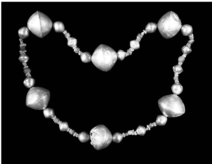
Náhrdelník (d. 66 cm) sestavený z korálů ze zlatého plechu, prokládaných skupinami nepravidelných korálků z chryzokolu, uprostřed s korálem ze sodalitu (Peru, severní pobřeží, Lambayeque-Sicán, 700–1100 n. l., Mus. Oro).

Patří k nim zlatý obřadní či obětní nůž tumi s čepelí ve tvaru půlměsíce a rukojetí v podobě antropomorfního boha Naymlapa s rozevřenými pažemi, držícího v ruce disky vykládané tyrkysem. Na hlavě má půlkruhovou filigránovou korunu zpestřenou tyrkysovými vložkami, které ozvláštňují i „okřídlené