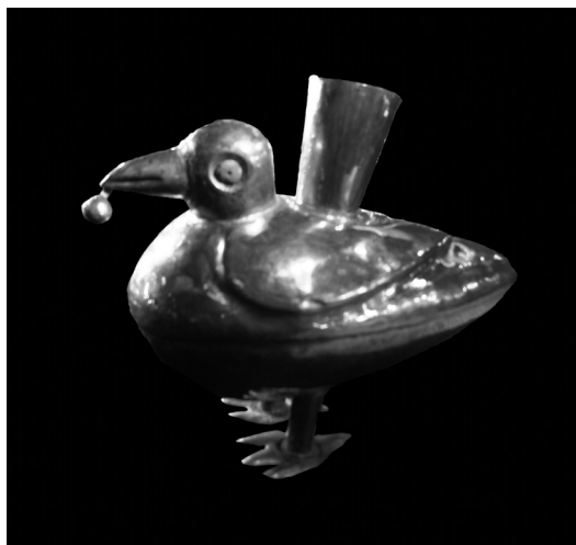
Jedna z páru zlatých nádob (14,5 × 8,7 cm) ve formě ptáka připomínajícího tinamu. Ptačí oči jsou vykládané chryzokolem (Peru, severní pobřeží, Lambayeque-Sicán, 700–1100 n. l., Mus. Oro).

Kolem roku 1100 n. l. bylo hlavní centrum Sicánců v Batán Grande vypáleno a opuštěno. Nové ceremoniální centrum, Túcume (El Purgatorio), bylo vybudováno na západ od něho. Pyramidy i jiné stavby ze sušených hlíněných cihel, např. Huaca Larga (Dlouhá), Huaca 1 a Templo de la Piedra Sagrada (Chrám