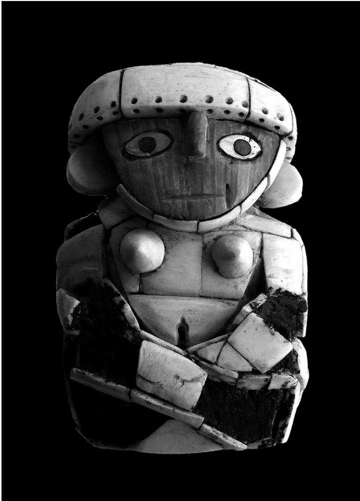
Ženská figurka (v. 12 cm), sestavená z plátků bílé spondylové mušloviny, má tvář z červené spondylové mušloviny a oči z perleti (Inkové, 1400–1532 n. l., Ethnolog. Mus.).

vložkou z chryzokolu. Atraktivní je pár roubíků (průměr 8,5 cm) z pozlaceného stříbra. Každý z nich je uprostřed okrášlený velkou kulatou chryzokolovou destičkou, lemovanou po obvodu devíti malými kulatými destičkami z chryzokolu (destičky jsou v centru provrtané). Jiný zlatý kulatý roubík je ozdobený prolamovanými tepanými reliéfy a v centru kruhovou vložkou z chryzokolu. Další