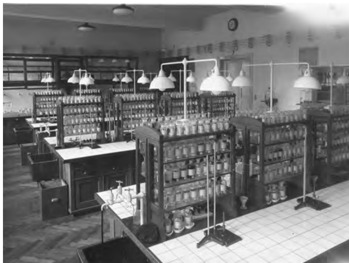
Laboratoř ústavu analytické chemie Přírodovědecké fakulty MU (30. léta 20. století)