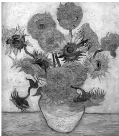
Gogh Vincent van, Slunečnice , olej, plátno, 1889

Dražitel Charles Allsopp však vyhnal cenu ještě výš, a to na 14 milionů a předpokládal, že dosáhne až na 15 nebo 16 milionů liber. Kdyby se ovšem kupec nedostavil, pak by obraz zcela propadl. Proto licitátor 4 dny před aukcí nepil alkohol a celé odpoledne 30. března roku 1987, v den aukce, běhal po parku. Dražbu po obraze Emila Noldeho začal u Goghových Slunečnic na pěti