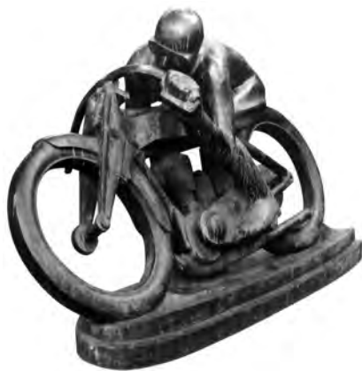
Švec Otakar, Sluneční paprsek (Motocyklista), bronz 1924

S prodejem získaných uměleckých děl je ovšem velmi opatrný, aby se nedostal do konfliktu zájmů, protože jako licitátor by neměl být překupníkem. Zároveň totiž sám může navrhopvat ceny, event. je zvyšovat apod. Musí přitom dávat pozor, aby nasadil cenu psychologicky správně, na takovou výši, která připraví kupující, že jde o mimořádné umělecké dílo, nesmí ji ale přemrštít, aby je neodradil.