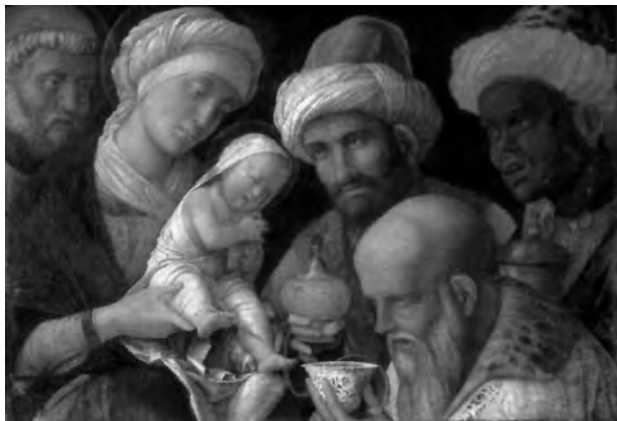
Mantegna Andrea, Klanění tří králů , olej na dřevě, kolem 1500

Případ obrazu Františka Kupky a ostatních uměleckých artefaktů patří zcela nepochybně do oblasti sběratelství. Ve sbírání patrně spočívá hromadící pud