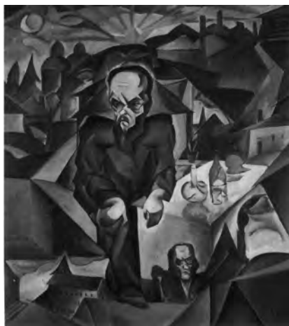
Foltýn František, Dostojevskij , olej plátno, 1922

Ještě před čtvrt stoletím se za obrazy významných malířů platilo nanejvýš do deseti milionů dolarů. Ale už v roce 1962 Metropolitaní muzeum v New Yorku vytvořilo nový světový aukční rekord, když vydražilo Rembrandtův obraz Aristoteles s Homérovou bustou za 2,3 miliony dolarů, podle tehdejšího kurzu