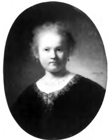
Rembrandt van Rijn, Ovalný portrét mladé ženy, olej na plátně, 1632

Dlouhou dobu byly sbírky jedním z nejdůležitějších prostředků reprezentace šlechty a knížat. Od dob renesance právě sbírky zvyšovaly prestiž a společenský význam nejen vládnoucích, nýbrž už i zámožných měšťanů. Velké sbírky antického umění shromáždili ve svém paláci ve Florencii Medicejští, konkurovali jim Brancacciové, ale i papežové jako Julius II. nebo papež Lev V. z rodu Medici, který jmenoval Raffaela konzervátorem římských starožitností. Ten sbíral a konzervoval staré nápisové desky, sochy a architektonické články antického Říma, které byly druhotně použity ve středověku a jimž hrozila zkáza. Ve Francii proslul sbíráním umění král František I., který od roku 1515 uváděl do Francie renesanci a stal se nejvýznamnějším francouzským podporovatelem umění. Povolal do zámku ve Fontainebleau umělce, jakými byli Leonardo da Vinci, jehož obraz Mony Lisy dodnes zdobí pařížský Louvre, manýristické malíře, mezi kterými se objevili Andrea del Sarto, Rosso Fiorentino, Francesco Primaticcio, Nicolò dell' Abate nebo slavný zlatník Benvenuto Cellini, dnes známý nejslavnějším zachovaným zlatnickým dílem, slánkou vytvořenou právě pro krále Františka I.; vlastní ji vídeňské muzeum, nedávno byla ukradena, a poté opět nalezena. Panovník ovšem zval do Fontainebleau i Michelangela, Tiziana a Raffaela a svým sběratelstvím vytvořil snad největší uměleckou sbírku na světě. Ta se stala po francouzské revoluci základem nejslavnějšího muzea na světě, pařížského Louvru.