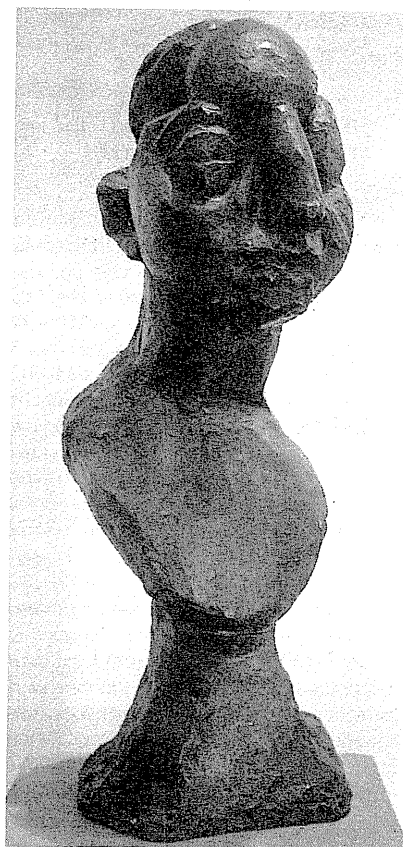
H. Matisse: Jeanette V. , 1910-1911