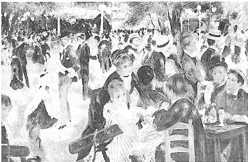
A. Renoir: Moulin de la Galette , 1876

a pozorné studium vzájemných vztahů a souvislostí přírodních jevů. Bezprostředně impresionistům předcházeli realisté Honoré Daumier, Jean François Millet, Gustave Courbet a další, obracející se rezolutně k přírodě a k sociálním problémům doby. Realisté se ovšem zajímali ještě o motiv, o objektivní předmět v reálném osvětlení a o materiální podstatu jevu. Proto například pozdější odborná literatura hledala děliččí čáru mezi realismem a impresionismem v rozdílnosti pojmů objektivní a subjektivní naturalismus, jímž ostatně impresionisty označil již Émile Zola. Po polovině století to byl ještě Jean-Baptiste Camille Corot, který obklopoval předměty na svých obrazech náladovým vzdušným oparem a za jehož žáky se prohlášovali dva z budoucích impresionistů – Camille Pissaro a Alfred Sisley. Podobně bývají označováni za nepřímé učitele Monetovy malíř mořského pobřeží Eugène Boudin a holandský krajinář Johann-Barthold Jongkind.