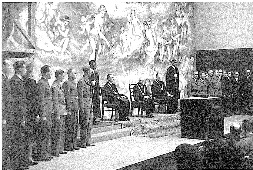
Jedna z prvních poválečných promocií v Auditoriu maximu na Právnické fakultě

Věková struktura studentů, kteří se v roce 1945 zapisovali ke studiu, byla zcela atypická. V roce 1946 byla například celá čtvrtina posluchačů Masarykovy univerzity starších 26 let, což souviselo s šestiletým uzavřením vysokých škol. Proto také řada posluchačů studovala „in absentia“, tedy při zaměstnání. To byl ovšem vážný problém, protože studijní literatury byl velký nedostatek. Výuku komplikoval havarijní stav řady poslucháren, které se dařilo uvádět alespoň do nouzového provozu jen za obětavé pomoci studentů a zaměstnanců univerzity. Ještě v sychravém podzimu roku 1945 byla okna některých poslucháren nezasklena a do místností zatékalo. Stopy války a okupace byly dlouho patrné na každém kroku. Přesto se Masarykova univerzita pozvolna vracela ke každodennímu životu. Například na Právnické fakultě ukončilo promoci své studium do konce roku