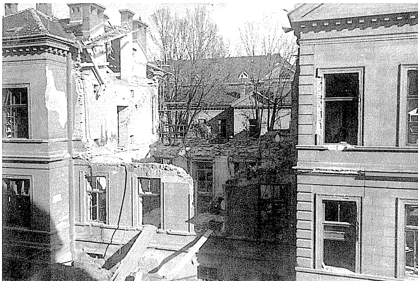
Přírodovědecká fakulta v roce 1945

V listopadu 1939 byla činnost Masarykovy univerzity, stejně jako ostatních českých vysokých škol, přerušena. Cílem okupantů však nebylo pou-