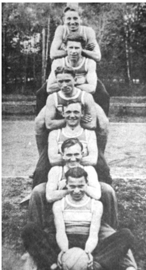
Obrázek 6. Mistři Slovenska ve volejbalu pro rok 1932– YMCA Banská Bystrica.

V pořadí VII. mistrovství republiky ve volejbalu se v roce 1930 poprvé konalo na území dnešního Slovenska, a to v Tatranské Lomnici ve dnech 16. a 17. srpna. Na této sportovní akci se mělo utkat devět nejlepších československých týmů – tři z Čech, Moravy a Slovenska. Z Čech však přijel pouze mistr – Strakova akademie Praha. Ze Slovenska se na tuto akci probojovali mj. volejbalisté YMCA Banská Bystrica. Těm se však příliš nedařilo.