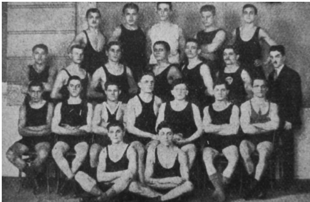
Obrázek 4. Těžkoatletický klub banskobystrické YMCA – TAC Ursus.

Těžká atletika v místním sdružení však nikdy nedosáhla popularity atletiky lehké a také zmínky o činnosti klubu TAC Ursus se v novinových článkách příliš nevyskytovaly. Je tudíž pravděpodobné, že se těžcí atleti banskobystrické YMCA závodů příliš neúčastnili nebo že tento klub velice záhy zanikl.