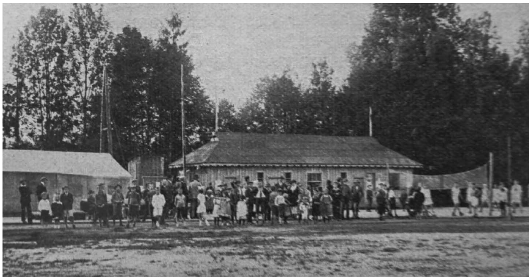
Obrázek 2. Pohled na hřiště YMCA v Banské Bystrici.