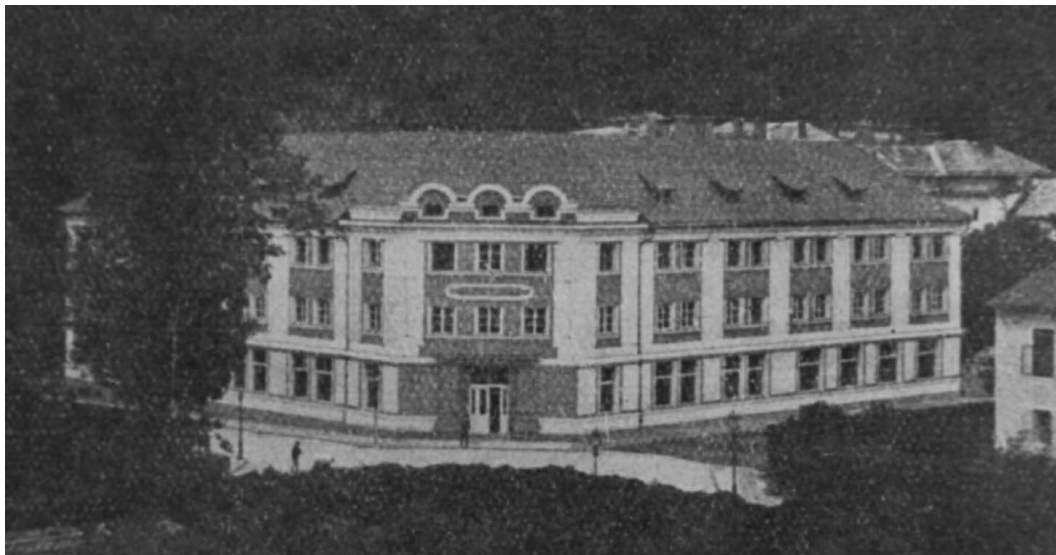
Obrázek 1. Budova místního sdružení YMCA v Banské Bystrici.

Budova (viz obrázek 1.), ve které bylo celkem 78 místností, začala od této doby sloužit jako základna pro nejrůznější aktivity místního sdružení YMCA v Banské Bystrici. 8