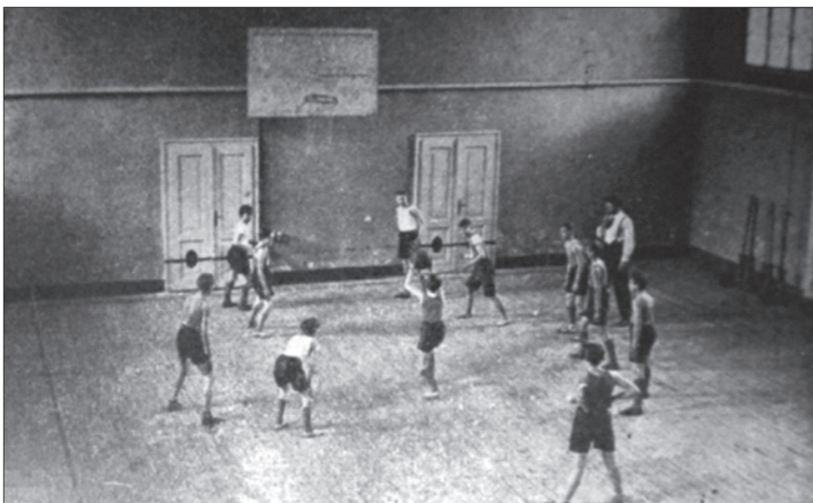
Obrázek 2: Basketbal v tělocvičně bratislavské YMCA v polovině 30. let

K velkému rozmachu basketbalu v bratislavské YMCA došlo v roce 1927, když byla dokončena přístavba budovy místního sdružení, ve které se nacházela tělocvična (viz obrázek 2), do které mohla YMCA přenést své tréninky z Medické zahrady či dvora Reálného gymnázia sídlícího na Dunajské ulici. Za hezkého počasí se však basketbal hrál i nadále pod otevřeným nebem. 23