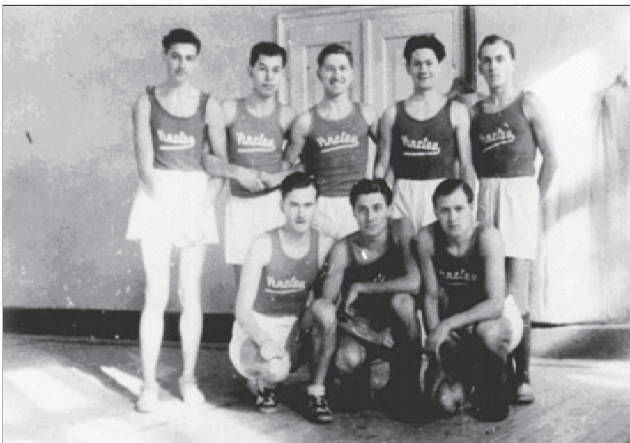
Obrázek 3: Skupina Vinetou – vítěz Bratislavské basketbalové ligy v sezónách 1936/1937 a 1937/1938

V roce 1935 obhájila bratislavská YMCA titul slovenského mistra a mohla se těšit na závěrečný republikový mistrovský turnaj, který ve dnech 13. a 14. dubna organizovala. V dopoledních hodinách druhého hracího dne oplátila YMCA Bratislava porážku Sokolu Královo Pole z minulého mistrovství. Na skvěle hrající basketbalisty YMCA Praha však bratislavští nestačili. Na turnaji tak vybojovali druhé místo. 32