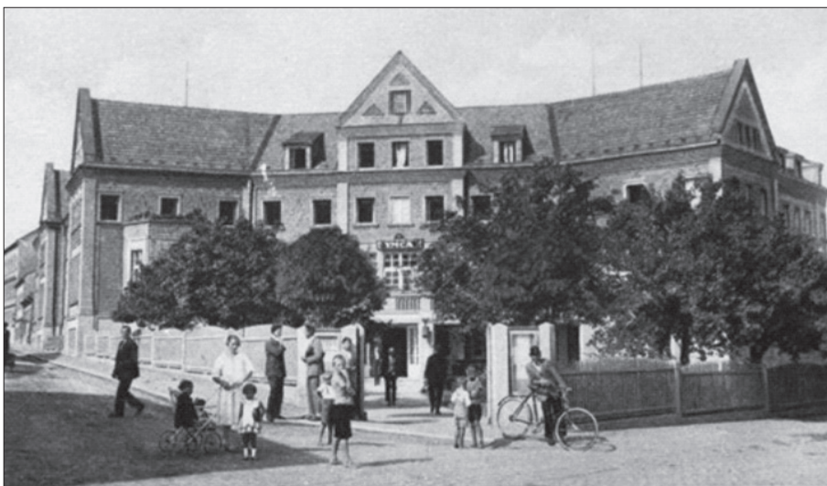
Obrázek 1: Pohlednice s motivem bratislavské YMCA

Nedlouho po příchodu YMCA do Bratislavy se zde objevil nápad postavit její samostatnou budovu ( viz obrázek 1 ). K tomu nutně musely být vyřešeny dvě podmínky, a to získání vhodného pozemku a zabezpečení financí na stavbu.