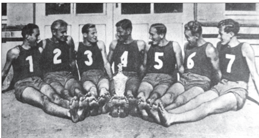
Obrázek 7: Volejbalisté YMCA Bratislava – mistři Slovenska pro rok 1935

Na podzim roku 1935 bylo na hřišti nováčka ČVaBS – SK Slavia Praha uspořádáno dvoudenní volejbalové republikové mistrovství. Celé mistrovství ovládli zcela zaslouženě volejbalisté Sokola Plzeň V., kteří neprohráli ani zápas. Jediný zástupce organizace YMCA a zároveň slovenský volejbalový mistr – YMCA Bratislava (viz obrázek 7), 65 jim podlehl 2 : 0. Ze sedmi týmů, které se na tento závěrečný volejbalový turnaj probojovaly, se YMCA umístila na posledním místě, když nevyhrála jediný zápas. 66