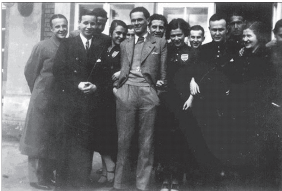
Obrázek 5: Stolní tenisté YMCA Bratislava a YMCA Banská Bystrica před budovou bratislavského sdružení roku 1932

Přesto nadále žila stolním tenisem. Koncem roku 1934 začali její hráči „chytat druhý dech“, i když na své dobré výsledky již nikdy zcela nenavázali. Následujícího roku se stala Bratislava, stejně jako v letech 1927 a 1932, hostitelem mistrovství Slovenska. Organizováním této akce byla pověřena právě místní YMCA.