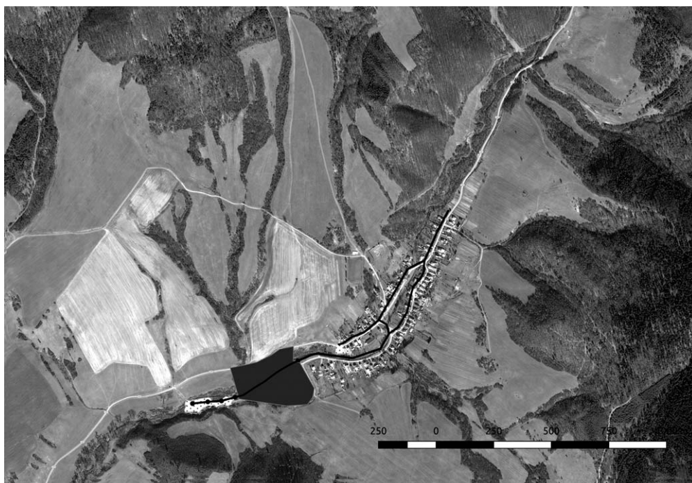
Obrázek 4: Zavedení veřejného osvětlení a neosvětlený prostor mezi osadou a obcí

Pohled obyvatel osady na důvod neexistence souvislého veřejného osvětlení mezi prostorem osady a majoritní obce byl odlišný. Po výstavbě veřejného osvětlení se obyvatele osady začali utvrzovat v pohledu na gádže jako zloděje. Předpokládali, že originální projekt byl plánován se souvislým osvětlením mezi osadou a majoritní obcí. Pokud však v tomto prostoru nejsou vztyčené sloupky veřejného osvětlení, celá výstavba byla o chybějící sloupky levnější a ušetřené peníze byly ukradeny členy obecního úřadu. Na případu výstavby veřejného osvětlení je zajímavá ještě jedna důležitá věc. Prakticky během půl roku byla díky existenci veřejného osvětlení v prostoru osady rozvedena ilegální elektrická síť, která jen utvrdila majoritu v jejich převládajícím pohledu na obyvatele osady jako zloděje. Na druhou stranu