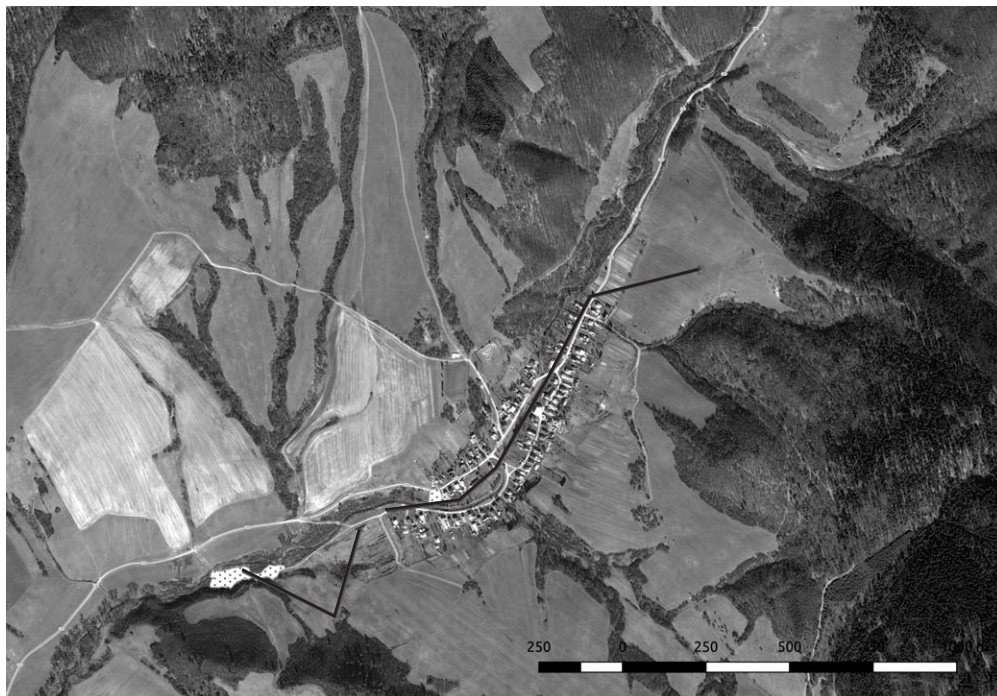
Obrázek 3: Zavedení paralelního veřejného vodovodu

Před elektrifikací se napouštěla voda do hrnců a musela se poměrně dlouhou dobu převařovat na kamnech. Posléze se hrnec musel něčím zakrýt a držet pod kontrolou, aby do něho nepadaly mouchy či jiná špína. Mnohokrát se stalo, že pokud hrnec, například z důvodu opuštění domácnosti kvůli neodkladným věcem, zůstal delší dobu bez kontroly a k převařené vodě mohl mít přístup prakticky kdokoliv, voda z něho byla jednoduše vylita a celý proces bylo nutné opakovat. Rychlovarné konvice tento proces zkrátily a díky nim lidé v osadě získali efektivní kontrolu nad kvalitou vody a svým zdravím.