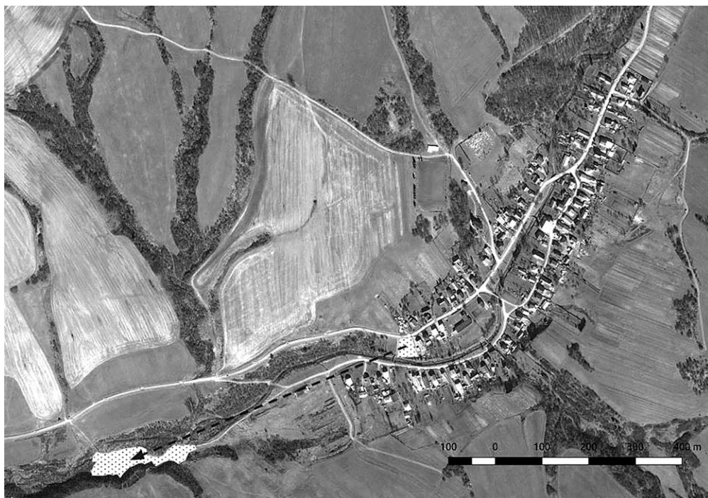
Obrázek 1: Vysídlení zakladatelského páru z areálu obce do prostoru současné osady

Dnes v tomto areálu žije okolo dvou set lidí, kteří jsou kategorizováni členy majority jako Romové nebo Cigáni, a přesídlení je možné chápat jako první krok rozpojení. Zakládající pár osady byl ještě klasifikován majoritou jako „naši Romové/Cigáni“, kteří se živili především pomocnými pracemi v zemědělství a drobnou kovářskou prací. Jejich potomci, kteří dnes tvoří většinu obyvatel osady a tvoří zhruba 40% podíl na celkovém počtu obyvatel obce (v obci v současné době žije 517 obyvatel), jsou majoritou popisováni jako „cizí Romové“ (viz Obrázek 2).