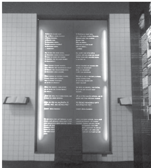
Foto 1: Pamětní deska deportací Romů z Brna položená ve stálé expozici MRK v místnosti věnované holocaustu Romů

Na ukázkách anonymní prezentace Romů v literatuře tematizující etnizované utrpení na území dnešní České republiky v období druhé světové války a vyjednávání expozice pomníku romských obětí druhé světové války v Brně jsem ukázala, jak místa paměti, která nesou explicitní romskou stopu, jsou buď znevýznamňována, nebo rovnou přemístována mimo všeobecný, neetnizovaný veřejný prostor. Symbolicky toto naznačuje a funkčně podporuje nedůležitost nebo nelegitimitu existence romské stopy v českém veřejném prostoru. Předchozí analýza může poukazovat na to, jak se český veřejný prostor na jednu stranu jeví jako etno-neutrální, je však spíše charakteru etnomajoritního. To možná samo o sobě nemusí být problém, problémem ale je, pokud je toto nereflexivně do veřejného prostoru podsouváno a není-li to veřejně diskutováno. Ostatně, při čtení sociologických prací zabývajících se pamětí musí čtenář nabýt dojmu, že více než reflexi a stále pokračující diskusi si v oblasti politiky paměti ani slibovat nemůžeme.