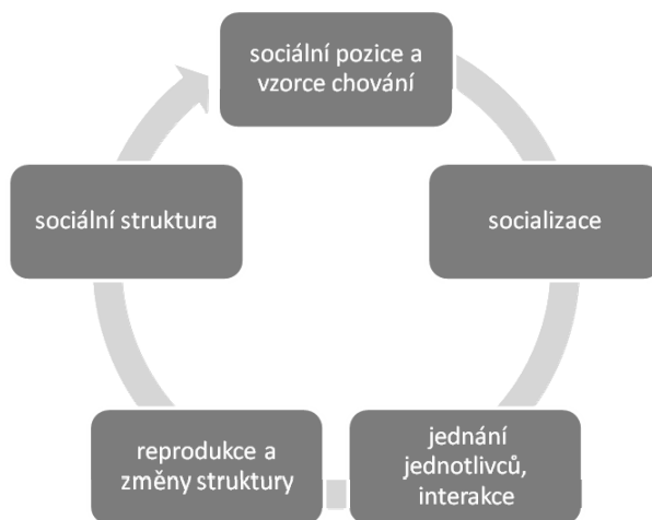
Obrázek 2: Model autogeneze sociální reality

Akceptujeme-li toto znázornění, můžeme říci, že difference mezi jednotlivými typy sociologických teorií jsou dány volbou výchozího bodu, z něhož se odpověď na zadanou otázku odvíjí. Výstavba „strukturálních“ teorií vstupuje do tohoto autogenetického koloběhu analýzou a modelováním procesů na horních rovinách schématu, a teprve potom se zabývá jejich zpětnými vazbami a propojením s rovinou dolní, které často postulují jen obecně nebo je pouze předpokládá. Teorie jednání naopak vstupují do autogenetického okruhu na jeho