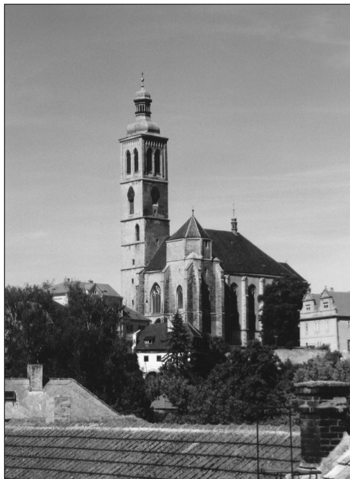
Obr. 3: Kostel sv. Jakuba v Kutné Hoře, původně horní kostel Panny Marie.

v závětech nebo je prodávaly podle potřeby. Bylo v zájmu hlavních stavebníků, aby bylo v kostele možné založit velký počet kaplí a oltářů. Přesto byl kostel vnímán jako obraz celé obce. Postavení laiků k církvi vyjadřuje vztah lodí k presbyteriu, poměr velikosti lodí a presbyteria, poměr výšky klenby presbyteria a lodí, to, kolik stupňů dělí presbyterium od podlahy lodí, zda je dělí příčná loď, přepážka či nikoli a jak je zvýrazněn (potlačen) předěl mezi lodí a presbyteriem, tedy triumfální oblouk. Uspořádání prostoru lodí (lodí) zobrazuje představu o obci a její hierarchizaci, význam obce může vyjádřit i počet a výška věží, ale i monumentalita celé stavby či její struktura a použitý materiál, jeho opracování a uspořádání a zejména vstupní portál.