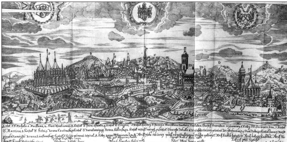
Obr. 1: Veduta Kutné Hory z přelomu 16. a 17. století od Jana Willenberga, kterou překreslil Jiří Čáslavský pro vydání (1675) Starých pamětí kutnohorských Jana Kořínka.