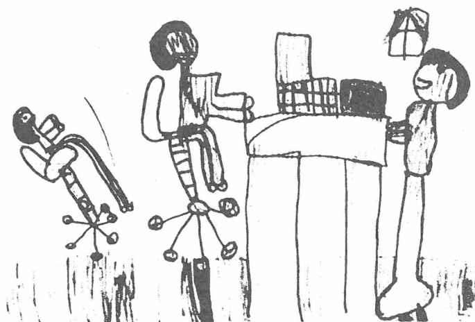
Obr. 2: Renko, 4 roky. Hra. Zobrazenie novej kvality videnia a zároveň spôsobu komunikácie.

deokazetách: Televízny film Sám doma, II. časť, Stratený v New Yorku sa stáva námetom detských kresieb, zobrazujúcich Kevina ako hlavnú postavu.