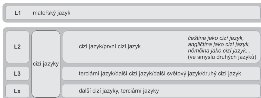
Obrázek 1. Návrh systematizace terminologie v oblasti označování a řazení jazyků.

zdá být v našem prostředí poměrně neukotvená a mnohdy nekompatibilní se zahraničím. Například Choděra (2006), ale také Hendrich (1988) používají ve svých pracích pojem druhý cizí jazyk , Repka a Gavora (1987) používají další světový jazyk , další cizí jazyk se pak objevuje v kurikulárních dokumentech (např. RVP ZV) a Andrášová (2011) pracuje s pojmem terciární jazyk . Pro ostatní jazyky se nejčastěji používá buď numerické označení (např. pro L4 třetí cizí jazyk či čtvrtý jazyk ) nebo se využívá souborného označení další cizí jazyky či terciární jazyky . Pro názornost jsme se pokusili uspořádat českou terminologii 10 v obrázku 1.