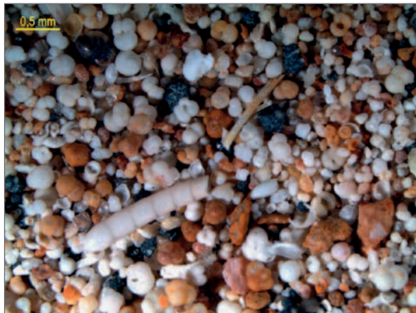
Obr. 3: Společenstvo foraminifer z vápničných jííl. Fig. 3: Assemblage of foraminifers from calcareous clays.

celkového trendu růstu relativní hladiny. Detailnější odlišení systémového traktu ve smyslu sekvenční stratigrafie vyžaduje širší srovnání.