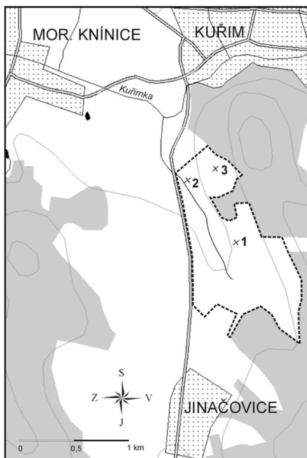
Obr. 1 – Situační mapka studovaných odkryvů v prostoru mezi Jinačovicemi a Kuřimí.

Severní část sportovního areálu patří do ochranného pásma jímacího území pitné vody Jinačovice s hydrogeologickým vrtem hlubokým 38,8 m (Malý 1966). V metráži od 3,6 až 38,2 m byly zjištěny neogenní sedimenty