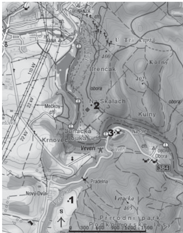
Obr. 1: Lokalizace studovaných odkrytí. Fig. 1: Situation of the studied outcrops.

Boskovické brázdy a západním okraji Bobravské vrchoviny. Tyto sedimenty byly dále studovány metodami sedimentární petrografie a sedimentologie za účelem určení jejich geneze, zdrojové oblasti a případné souvislosti jednotlivých výskytů. V tomto příspěvku jsou prezentovány výsledky studia tří lokalit tj. plošiny „U buku“, lesní plošiny nad Junáckou loukou a plošiny u myslivny Na Pile. Oblasti výzkumu jsou znázorněny na obr. 1.