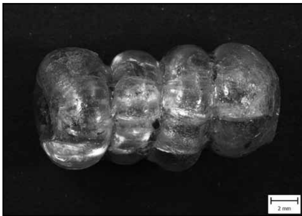
Obr. 2: Čtyřikrát členěný korálek nalezený v hrobu JP/022 (velkomoravské hradiště Břeclav-Pohansko).

Břeclav-Pohansko, jižní předhradí; rok 1962; čtverec L 16–74; antropologické určení: dítě asi 10 let. Obdélníková jáma 185 × 90 × 75 cm (hloubka od skrytého podloží); orientace SSZ–JJV. V horní části hrudníku mezi dislokovanými kostmi bylo nalezeno 30 skleněných korálek (z toho 27 celých). Náhrdelník složený z 27 celých skleněných korálek a 3 zlomků obsahoval 19 příčně členěných korálek: jeden sedmkrát členěný, jeden šestkrát členěný, devět čtyřikrát členěných (obr. 2), sedm třikrát členěných a jeden dvakrát členěný; dva sekané válcovité zelené korálky; šest drobných tmavomodrých kotoučovitých korálek (jedna bronzová trubička po korálku a zlomky dvou korálek – nedochováno); inventární číslo P38302.