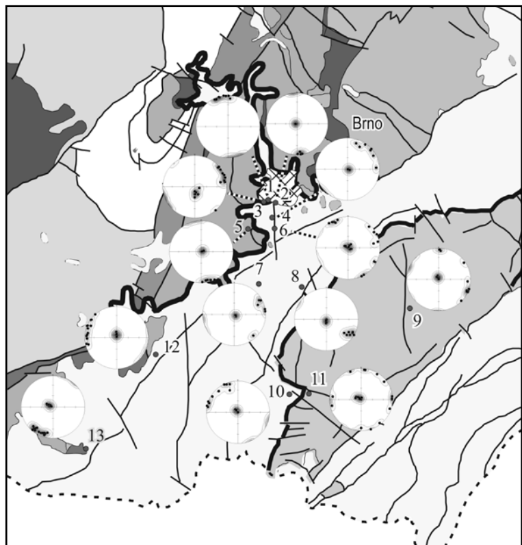
Obr. 1: Schematická geologická mapa jižní Moravy s vyznačením polohy studovaných lokalit s jednotlivými diagramy přednostní orientace puklin: 1 – Brno-Bohunice, 2 – Brno-Červený kopec, 3 – Brno-Štýřice, 4 – Horní Heršpice, 5 – Nebovidy, 6 – Modřice, 7 – Ledce, 8 – Židlochovice, 9 – Krumvíř, 10 – Dolní Věstonice, 11 – Pavlovské vrchy, 12 – Miroslav, 13 – Tasovice.

Terénní práce byly prováděny v sezóně 2008 a 2009. Pozice lokalit byla určena pomocí GPS navigace. Na každé lokalitě byla otestována přítomnost karbonátu zředěnou