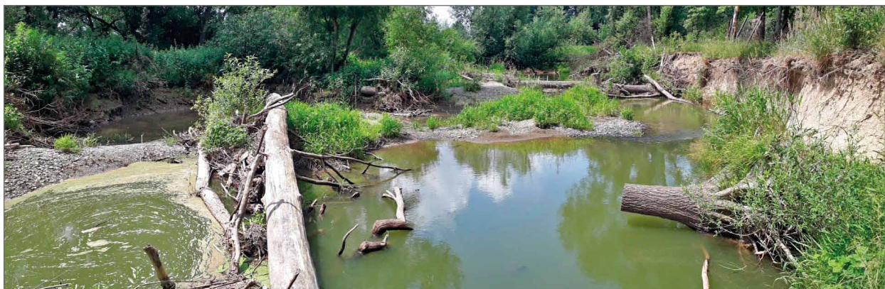
Obr. 1: Panoramatický snímek zájemové oblasti (v levé části snímku lze vidět zmiňovanou boční tůň, v pravé části například vývrát po viditelném antropogenním zásahu).

Terénní práce probíhaly ve dvou etapách, v červenci a říjnu roku 2017. V období mezi těmito měsíci nebyly zaznamenány žádné zvýšené průtoky, které by ovlivnily korytovou morfologii. Prvním krokem bylo geodetické zaměření lokality pomocí totální stanice Topcon GTS-233N. Zaměřena byla morfologie koryta a poloha jednotlivých kusů říčního dřeva. Byly zaznamenávány pouze velké kusy dřevní hmoty o délce \geq 1 m a průměru kmene \geq 10 cm (tzv. LW , z angl. large wood ). U říčního dřeva byly zaznamenány jeho následující parametry: délka, tloušťka na jeho obou koncích a přítomnost kořenového balu. Délka byla měřena s použitím svinovacího metru s přesností