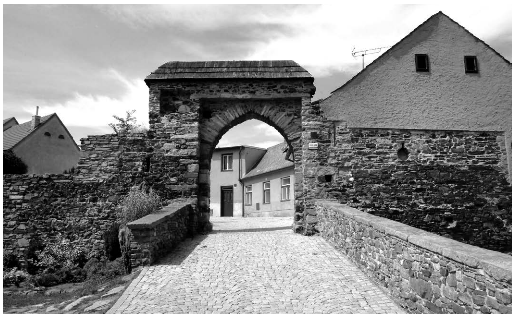
Obr. 7. Pozůstatky městského opevnění v Jemnici. Foceno v srpnu 2019. Uloženo v archivu autora.