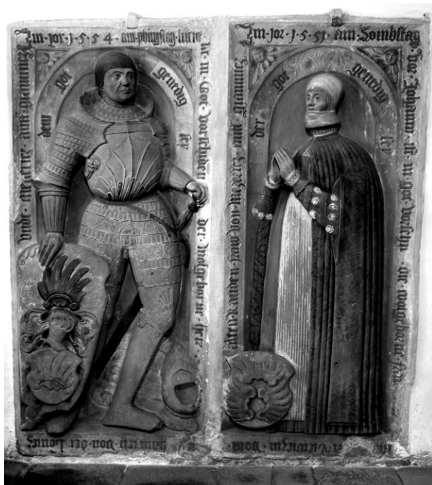
Obr. 1. Náhrobek Jindřicha Meziříčského z Lomnice a jeho manželky Anny Litvicové ze Starého Roudna. Foceno v srpnu 2019. Uloženo v archivu autora.