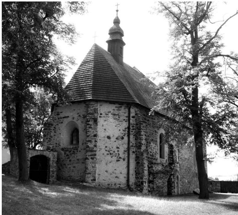
Obr. 3. Kostel sv. Víta v Jemnici. Foceno v srpnu 2019.