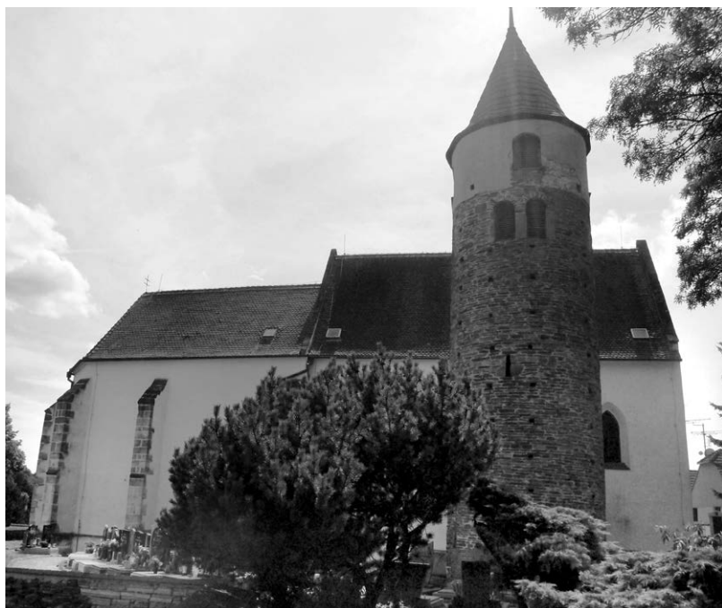
Obr. 4. Kostel sv. Jakuba Většího v Jemnici Na Podolí. Foceno v srpnu 2019.