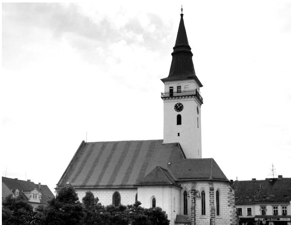
Obr. 2. Kostel sv. Stanislava na náměstí Svobody v Jemnici. Foceno v srpnu 2019.