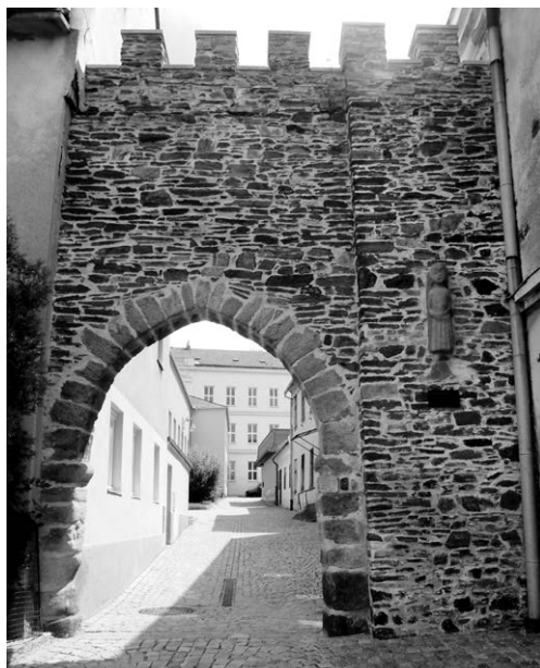
Obr. 5. Pozůstatky městského opevnění v Jemnici. Foceno v srpnu 2019.