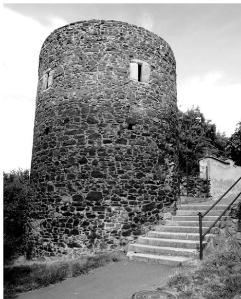
Obr. 6. Pozůstatky městského opevnění v Jemnici. Foceno v srpnu 2019.