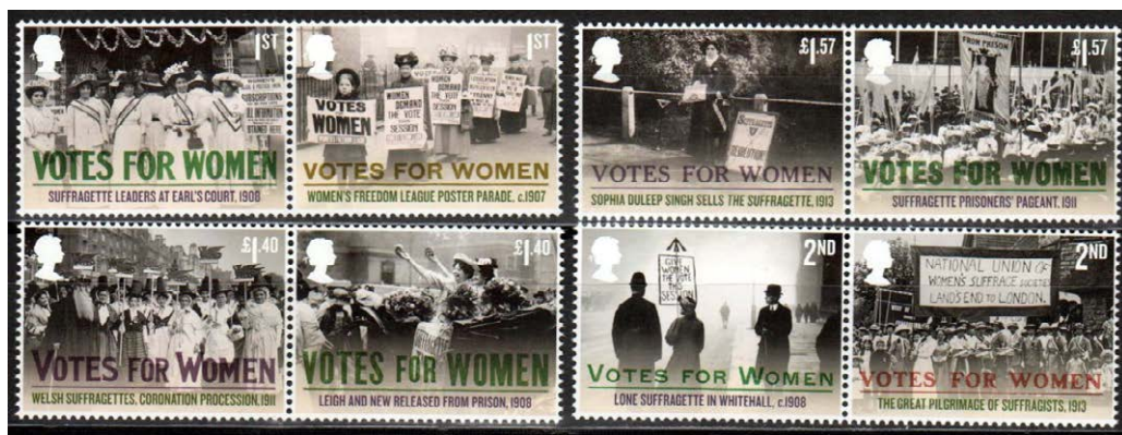
Obr 2. VB (2018): Finální série k oslavám stého výročí práva žen volit do parlamentu – zachycuje demonstrace i průvody oslavující propuštěné aktivistky.

Poštovní známky nezobrazují výlučně muže a jejich role. Jsou odrazem své doby, a proto představují nejen zobrazení mužů jako představitelů politické moci, vědy, techniky a kultury, žen jako ochránkyň zázemí domácnosti a rodiny, ale i narušení tradovaných pravidel. Didaktický potenciál známek v tomto ohledu podporují jejich charakteristické rysy. Nejenže odrážejí aktuální dobové priority 6 , poukazují také na priority a hodnoty, které daná společnost hodlá připomínat a pěstovat v kolektivní paměti – tzv. výroční známky (právě např. boj za volební právo žen). Samy o sobě nám však nepodávají (přímou) zprávu o důvodech, které bránily účasti žen, a v historické edukaci musí být doplněny dalšími didaktizovanými informačními zdroji.