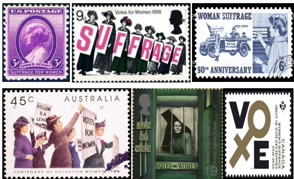
Obr. 1. USA (1936): aktivistka hnutí; VB (2018): nerealizovaný návrh ke 100. výročí; USA (1970): sufražetky a volička k 50. výročí 19. dodatku; VB (1999): ze série Millennium – vězněná sufražetka; Austrálie (1994); Kanada (2016).

Poštovní známky jsou takřka dvě století svědkem a doprovodným jevem specifického druhu komunikace. V průběhu času se rozvinuly ve svébytné vizuální médium a vytvořily samostatný obraz světa. Tento obraz světa pochopitelně nemůže být dostatečně komplexní, plastický a jeho izolované uplatnění v dějepisné výuce zdaleka nedává žákům možnost porozumět probíranému tématu v souvislostech či dostatečné hloubce. Předkládaný příspěvek se přesto optikou poštovních námětů zaměřuje na jednu z aktuálních oblastí s mezipředmětovým dosahem – genderovou problematiku. V jejím rámci je s ohledem na vymezený rozsah textu dále zúžena na dílčí tematiku