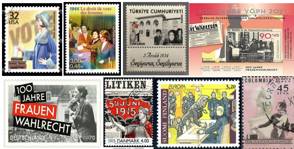
Obr. 3. Výroční známky – volební právo žen: USA (1998); Francie (2000); Dánsko (2000) alegorický výjev z titulní stránky dobového časopisu; Německo – výjev listopadové revoluce 1918 (2019); Rakousko (2019) – aršík ke 100. výročí; Finsko (1996) – 90. výročí; Turecko (2018); Kolumbie (1963).

I s ohledem na vymezené cíle byla zjištění směřována k četnosti výskytu dobové medializace anebo jejich výročních připomínek. Již zběžná analýza zahraničního i domácího filatelického materiálu naznačuje koncentraci připomínek organizovaného veřejného boje aktivistek a také oslav výročí zavedení volebního práva pro ženy. Samozřejmě nás bude zajímat s jakou četností se téma v té, které zemi vyskytovalo, ačkoli poskytnout důslednou statistiku napříč zahraničím by si vyžádalo zcela odlišný rozsah zkoumání i textu.