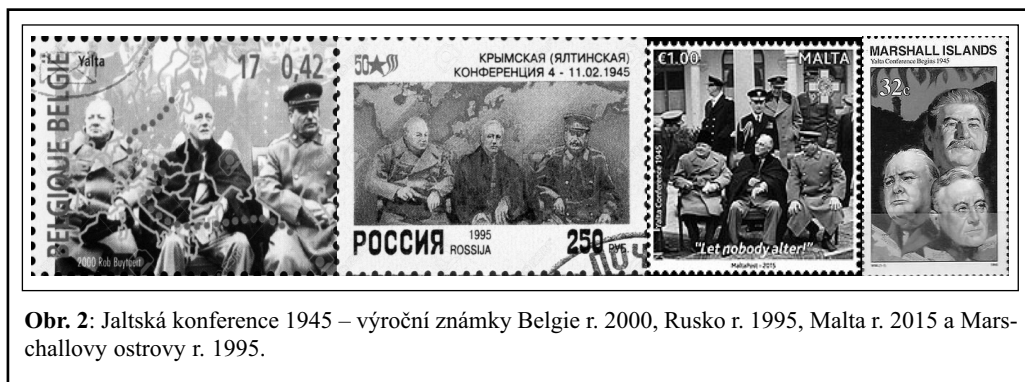
Obř. 2: Jaltská konference 1945 – výroční známky Belgie r. 2000, Rusko r. 1995, Malta r. 2015 a Marshallovy ostrovy r. 1995.

Rumunsko vystupující v roli německého satelitu patří k těm nemnohým, které uplatněním jednoduché symboliky medializovalo výjimečně i známkovou produkcí svoji příslušnost k Ocelovému paktu a tudíž i „náhradní“ územní zisky (za ztrátu severního Sedmihradska a jižní Dobruďže – 1940): série tří známek z r. 1942 – jedna s portréty vůdců paktu, rumunského panovníka a obrysem územního záboru po přepadení SSSR (rum. Besarabia).