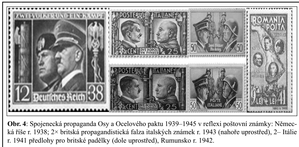
Obr. 4: Spojenecká propaganda Osy a Ocelového paktu 1939–1945 v reflexi poštovní známky: Německá říše r. 1938; 2× britská propagandistická falza italských známek r. 1943 (nahore uprostřed), 2– Itálie r. 1941 předlohy pro britské padělky (dole uprostřed), Rumunsko r. 1942.