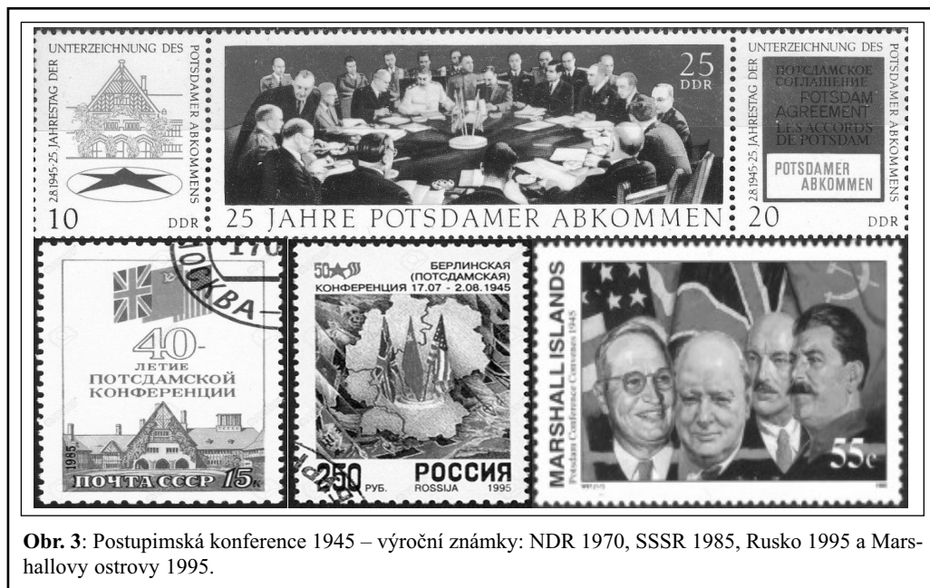
Obr. 3: Postupimská konference 1945 – výroční známky: NDR 1970, SSSR 1985, Rusko 1995 a Marshallovy ostrovy 1995.

(rudý podklad). Aplikace prvků marxistické symboliky nejen propagandisticky posouvá výklad akce, ale činí tak zcela v stereotypních intencích komunistické obrazové diktatury.