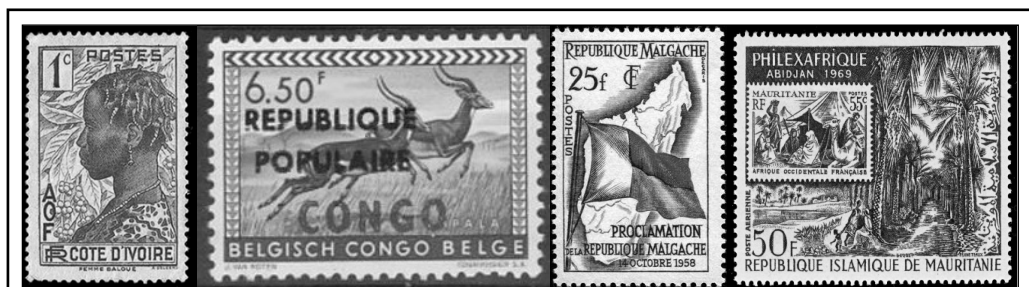
Obr. 3: (Bývalé) nebritské državy zde zastupují francouzská a belgická zámořská panství. Ukázky dokládají všechny klíčové etapy procesu: koloniální, přetiskové i známky výroční nezávislosti. Idylická domorodá tematika převažuje. Některé země zachovaly svůj koloniální název i po získání nezávislosti: Pobřeží slonoviny r. 1960, fr.: Côte d'Ivoire (vlevo) nebo původně francouzská Mauretánie taktéž r. 1960, (zcela vpravo). Francouzský Madagaskar naopak v r. 1960 změnil (dočasně) své pojmenování na Malgašskou republiku.

Příběh zámořských držav a jejich poválečného rozkladu není černobílý. Protikoloniální euforie padesátých a šedesátých let sama o sobě nestačila zajistit nově vznikajícím státním celkům prosperitu a bezpečnost. Zanechala po sobě nicméně nesmazatelnou mediální stopu mj. v podobě známkových motivů, jejichž analýzou a interpretací ve výuce rozvíjíme kompetenci rozpoznávat a správně interpretovat propagandistické prvky v mediálním sdělení. 10