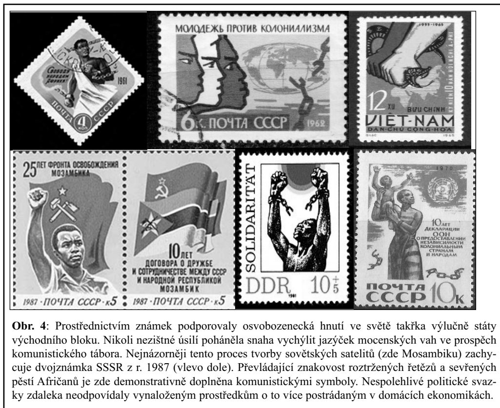
Obr. 4: Prostřednictvím známek podporovaly osvobozené hnutí ve světě takřka výlučně státy východního bloku. Nikoli nezištné úsilí pohaněla snaha vychýlit jazýček mocenských vah ve prospěch komunistického tábora. Nejnázorněji tento proces tvorby sovětských satelitů (zde Mosambiku) zachycuje dvojnámka SSSR z r. 1987 (vlevo dole). Převládající znakovost roztržených řetězů a sevřených pěstí Afričanů je zde demonstrativně doplněna komunistickými symboly. Nespolehlivé politické svazky zdaleka neodpovídaly vynaloženým prostředkům o to více postrádaným v domácích ekonomikách.

Přesvědčovací strategie: Jaký dojem se pokouší podoba a forma obrazového sdělení vyvolat (správnost aktuálního stavu, nastoupené cesty, kritiky aktuálního stavu? Jakými prostředky (barva, stylizace, symbolika, text, celkové uspořádání) se toho pokouší dosáhnout?