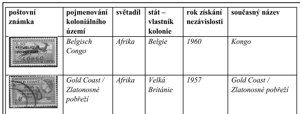
Obr. 5: Návrh tabulky pracovního listu.

Návrh pracovního listu s ukázkou doporučeného řešení: