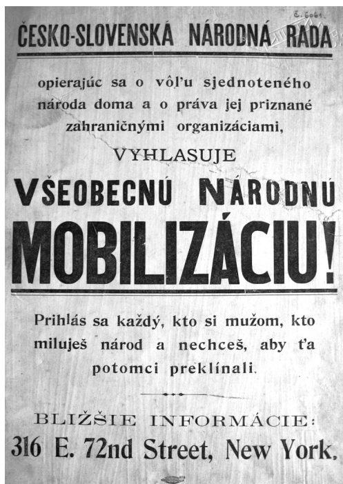
Obr. 7. Výzva ČNS k všeobecné národní mobilizaci krajanů vydaná v říjnu 1917.