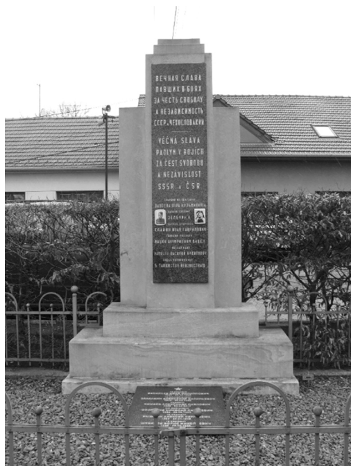
Pomník v parku „Na Budínku“ v Kobylnicích.