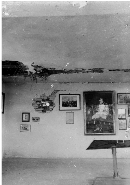
Poškozený interiér muzea v areálu památníku Mohyla míru.