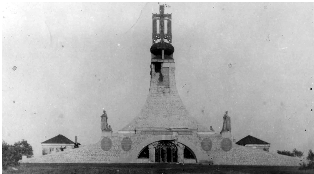
Poškozený památník Mohyla míru.