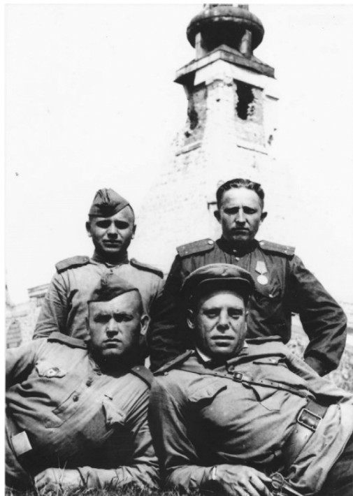
Sovětsí vojáci před poškozeným památníkem Mohyla míru.