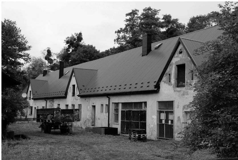
Budova ovčince hospodářského dvora na Stránce, stav v roce 2017.

Konečně nejstarší již od středověku v písemných pramenech doložený Dolní dvůr (Niederhof) se rozkládal v katastru sousední obce Branky (dnes Branka u Opavy) po pravé straně cesty z Hradce do Opavy. Existence panského dvora byla pro Branku významná, celá historie obce s ním byla provázána. Měl rozlohu 420 ha a to i s cestami a kopcem, který byl původně jen porostlý křovím a trním a teprve když se počet místních obyvatel zvýšil, v roce 1823 kopec vymýtili, kamení vykopali a pozemek na kopci rozparcelovali na role. Uvedenou trať pak v Brance nazývali Kopaninou. Ke dvoru též původně patřil pozemek na pravém břehu řeky Moravice tzv. Maršovec. Obdobně jako na Kopanině také zde se nejprve rozkládaly ovčí pastviny, až později byl Maršovec směnou pozemků přeměněn v ornou půdu braneckých obyvatel. K tomuto pozemku totiž dvůr neměl pro neexistenci mostu přístup (dříve byly dvorské pozemky celistvé, ale protože řeka změnila své řečiště – nové koryto dvorský pozemek rozdělilo). Když za panování Josefa II., došlo v obci k číslování domů, měla Branka 31 čísel a dvůr měl číslo poslední. 21