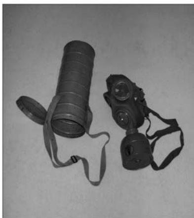
Maska S-35-38 VM-1a.

Přestože československý meziválečný chemický průmysl byl vyspělý a od roku 1923 byla zahájena výroba plynových masek a filtrů pro armádu nezávisle na zahraničí, výroba plynových masek pro potřeby ochrany obyvatelstva byla zahájena až v roce 1937. Soutěž na výrobu plynové masky pro obyvatelstvo byla sice vypsána již v roce 1933, avšak přes zdoluhavé řešení otázky výroby, stanovení její prodejní ceny, zásad distribuce atd., koncese na její výrobu byly uděleny vybraným firmám až v roce 1937. Takže distribuce těchto masek byla prováděna prakticky až před okupací. Tyto průtahy byly také částečně zapříčiněny firmami, ucházejícími se o výrobu, neboť se jednalo o lukrativní státní zakázku. 44