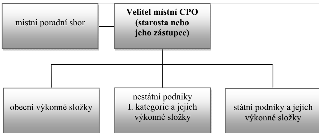
Schéma organizace civilní protiletecké ochrany v obci 40