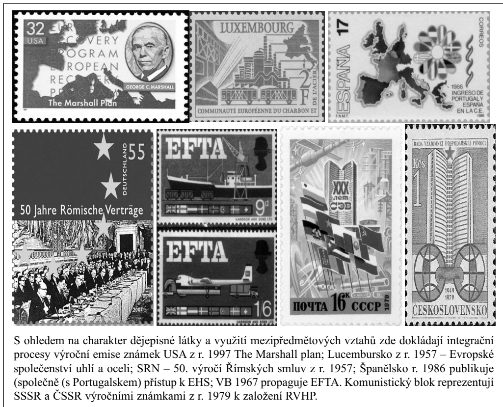
S ohledem na charakter dějepisné látky a využití mezipředmětových vztahů zde dokládají integrační procesy výroční emise známek USA z r. 1947 The Marshall plan; Lucembursko z r. 1957 – Evropské společenství uhlí a oceli; SRN – 50. výročí Římských smluv z r. 1957; Španělsko r. 1986 publikuje (společně s Portugalskem) přístup k EHS; VB 1967 propaguje EFTA. Komunistický blok reprezentují SSSR a ČSSR výročními známkami z r. 1979 k založení RVHP.

Po 2. světové válce se ve světě objevuje nový fenomén zvaný integrace (např. NAFTA, ASEAN, atd.), který se snad nejvýrazněji projevil právě v Evropě. Příčiny, etapy jsou v rozsáhlé odborné literatuře dobře popsány, analyzovány i interpretovány a přiměřená pozornost je jim věnována také v dějepisné výuce. Při glosování známkové produkce je přesto nezbytné připomenout některá fakta a souvislosti.