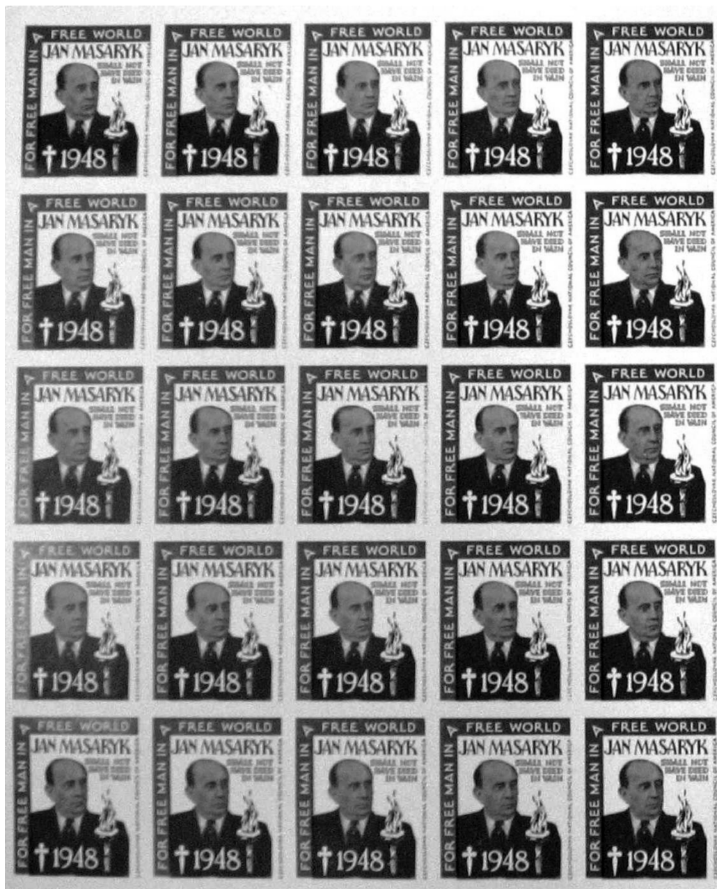
Aršík s poštovními známkami, které vydala ČSNRA při příležitosti prvního výročí tragické smrti Jana Masaryka.