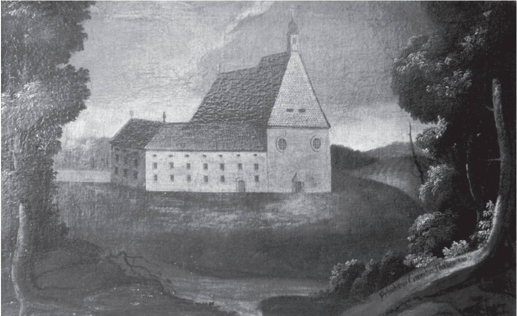
Obr. 1: Thalheim (dnešní Oberthalheim) – primogeniturní klášter německo-české provincie. Olejomalba neznámého autora z 18. století, nacházející se v paulánském konventu Vranov u Brna, zachycuje (domnělou?) původní podobu kláštera.

v Thalheimu roku 1514 v pověsti svatosti a byl zde také pohřben. 26 Téhož roku získal jeho nejmenovaný nástupce od salcburského kardinála Matouše pro kostel sv. Anny odpustky pro určité sváteční dny.