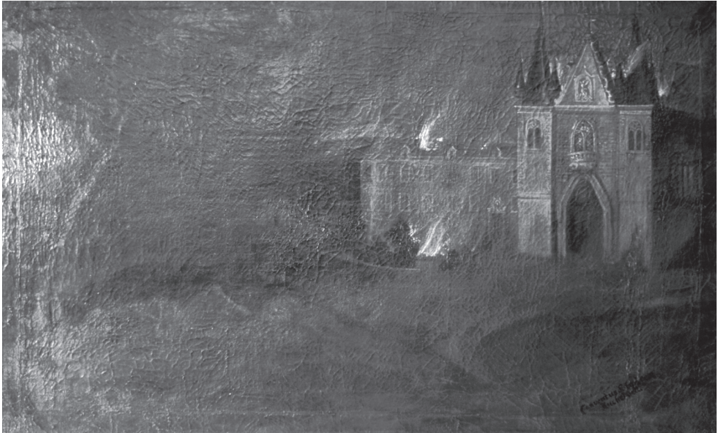
Obř. 3: Zánik paulánského kláštera v Kuklově na olejomalbě neznámého autora z 18. století. Inventář paulánského kláštera Vranov u Brna.

Opuštěné obydlí řeholníků připadlo opět Rožmberkům, kteří zde nechali zřídít pivovar a hospodářský dvůr. V pozdějších letech se už o poustevnické tradici či o poušti čili sídlu poustevníků na Kuklově dozvídáme pouze z drobných zmínek spojených s návštěvou tohoto místa nějakou významnou osobou. Když 5. září roku 1594 odjel Petr Vok na protiturecké tažení do Uher, jeho paní Kateřina Rožmberská z Ludanic „[...] byvši tak teskliva po pánu, uchýlila se do samoty a zůstala tam ve dvoře na té poušti na Kuklvejtě [...]“. 41