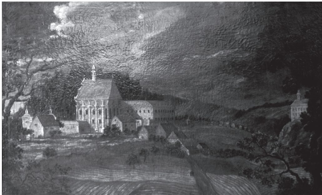
Obř. 2: Paulánský klášter (pravděpodobně v Kuklově). Olejomalba neznámého autora z 18. století nacházející se v klášteře Vranov u Brna.

Zmíněná korespondence z roku 1530 je posledním písemným pramenem, který se vztahuje k fungujícímu konventu. K zániku ještě ne zcela dostavěného kláštera došlo zřejmě někdy v průběhu třicátých let 16. století nebo brzy poté. 38 Příčin konce řeholního života na Kuklově bylo nepochybně více. V historické paměti místních obyvatel se však nejpevněji uchytila událost vázaná k roku 1533. Blíže neidentifikovaní „přivrženci reformace“ měli přepadnout a zapálit klášter a jeho obyvatele pověsit na lípě nacházející se na klášterní louce. 39 Přestože se přepadení kláštera a zabití mnichů nedá vyloučit, jako pravděpodobnější příčina zániku řeholního života v kuklovském klášteře se jeví například požár v kombinaci s hospodářskými problémy či úpadek morálky ve spojení s nástupem reformace. Skutečnosti, že ukončení dějin konventu nemuselo být násilné, nasvědčuje nedatovaný list, který zaslali představení minoritského kláštera v Českém Krumlově poručníkům rožmberských sirotků: „ Vašim Milostem oznamujeme, že bratr Martin, který jest byl prve u svatého Ondřeje na Kuklwajtu, když jsú se všickni bratři rozešli, a on přišel k nám do kláštera, prosil nás, abychme jeho k sobě přijali. I přijali jsme jeho a přirekli jsme mu stravu dávatí a do smrti jeho v klášteře chovati. A v tom čase byl šel do Říma. A když se zase navrátil, šel po nějaké potřebě k hutarovi v Latráně podle mostu a tu jest umřel. I zůstalo po něm půl devatenáctý kopy, kteréž byl skrze almužnu jemu danú zachoval. A přátelé