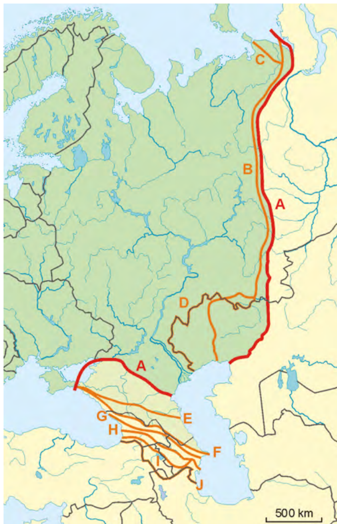
Mapa č. 1: varianty východní hranice Evropy