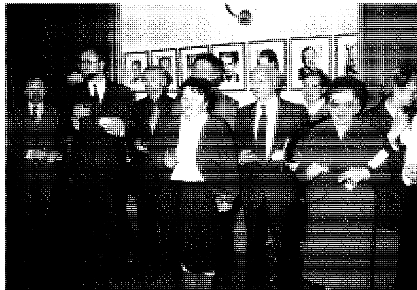
Slavnostní otevření galerie děkanů právnické fakulty Masarykovy univerzity v Brně dne 24. ledna 1994.