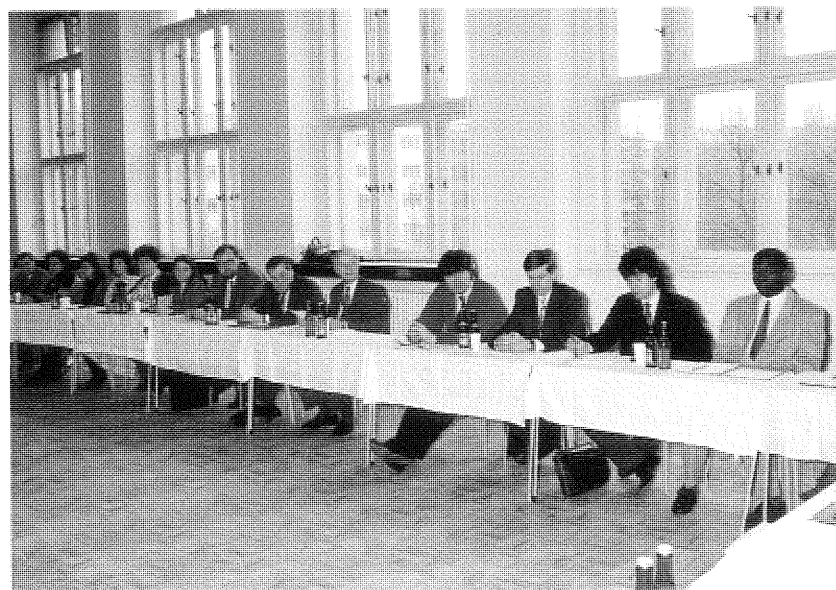
Jednání vědecké konference „Smluvní princip a jeho projev v individuálním pracovním právu“.