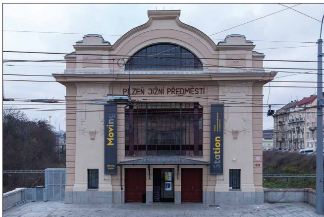
Obr. 2. Rekonstruovaná budova nádraží – hlavní průčelí otočené k mostu.

práci mezigeneracemi, mezi kulturami. Proto také spolupracujeme s řadou kolegů z jiných oblastí. Proto u nás můžete potkat dětské projekty, ale také Jeden svět nebo ArabFest či Animánii. Chceme být mostem, tak jak nám to naznačuje i naše specifická poloha. “ (Černík 2016) Do budoucna by budova měla zajišťovat i rezidenční pobyty plzeňských a zahraničních tvůrců. Cílem sdružení je vytvářet prostor pro současné umění, tvořit a tvorbou reflektovat současná témata a proměňovat vnímání umění a kultury města i regionu. Sdružení Johan je zaměřeno i na komunitní a sociální projekty. Proto je součástí osobní a sociální rozvoj komunitně orientované sociální práce, jejichž účelem je rozvoj komunity a práce s dobrovolníky. Pro sdružení je zásadní zapojení do občanských aktivit a úsilí o revitalizaci a animaci místa nabývající formy site-specific (Hulec 2015; Johan centrum 2016).