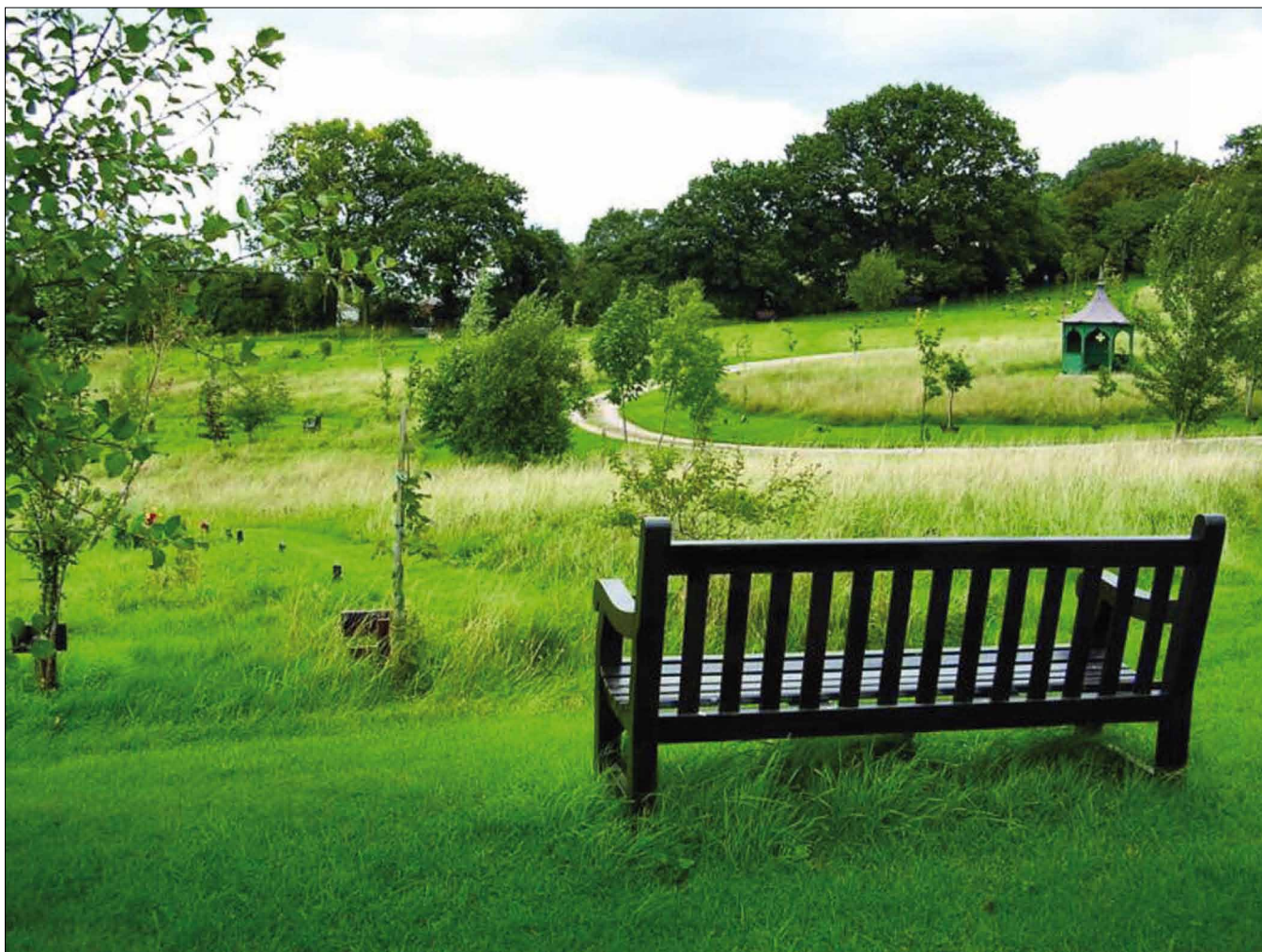
Obr. 2. Přírodní hřbitov Westall Park, Velká Británie.