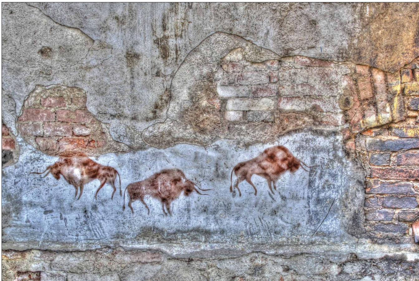
Obr. 1. Malby bizonů inspirované magdalénským jeskynním uměním, „Ulice s popelnicemi“, Český Krumlov, Áčka.

nosochařství, užité fotografie a médií. Jako mnoho začínajících umělců žili tito mladí lidé svůj nomádský život bez finančních prostředků tak trochu „na hraně“ přežívání. Díky podpoře Egon Schiele Art Centrum se jim ale otevřely dveře jednoho z ateliérů, včetně jeho příslušenství (apartmánu), umožňujícího mladým umělcům zde nejen tvořit, ale i normálně žít. O tom, co tato pomoc pro ně znamenala, svědčí slova mladé výtvarnice, která zázemí apartmánu komentovala slovy: „Nikde jsme se neměli lépe.“ Není divu. Zde mohli alespoň na pár měsíců spojit lásku s uměním a důstojným životem. S tvorbou této italsko-české tvůrčí dvojice, která dnes společně vystupuje pod označením Áčka , vstoupila do ulic Českého Krumlova osobitá poetika umění street art. Jejich touha oživit ulice města našla například vyjádření ve výtvarném projektu, v rámci něhož nalepili papírové oči na místní hydranty, dopravní zrcadla a dopravní značky zákazu vjezdu. Kontroverzní reakce vyvolali také papíroví osmimetroví lovci vytvoření ve stylu jeskynních maleb, které Áčka umístili na jednu s fasád Egon Schiele Art Centrum jako upoutávku výstavy Umění v každodennosti . V této souvislosti je ale důležité podotknout, že Áčka při své tvorbě aplikované na zdi a omítky domů programově používají neagresivní recyklovatelné materiály, jako jsou papír a vodou ředitelné tapetové lepidlo, jež se dá snadno odstranit. Áčka mají také zásadní podíl na vzniku projektu Ukradená galerie , který k prezentaci uměleckých děl ve veřej-