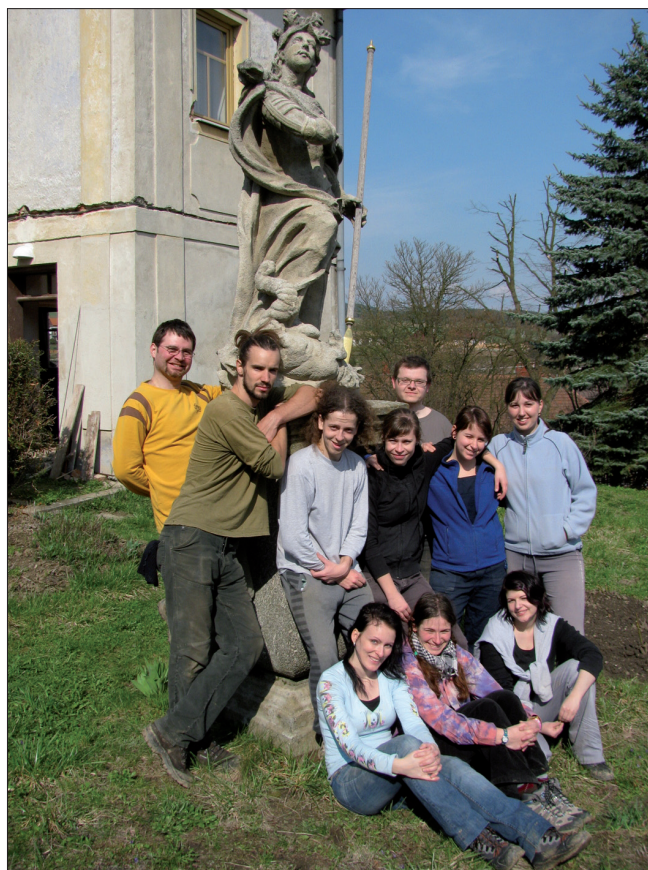
Obr. 12. Tasov. Účastníci výzkumu roku 2010 pod sochou sv. Jiří.