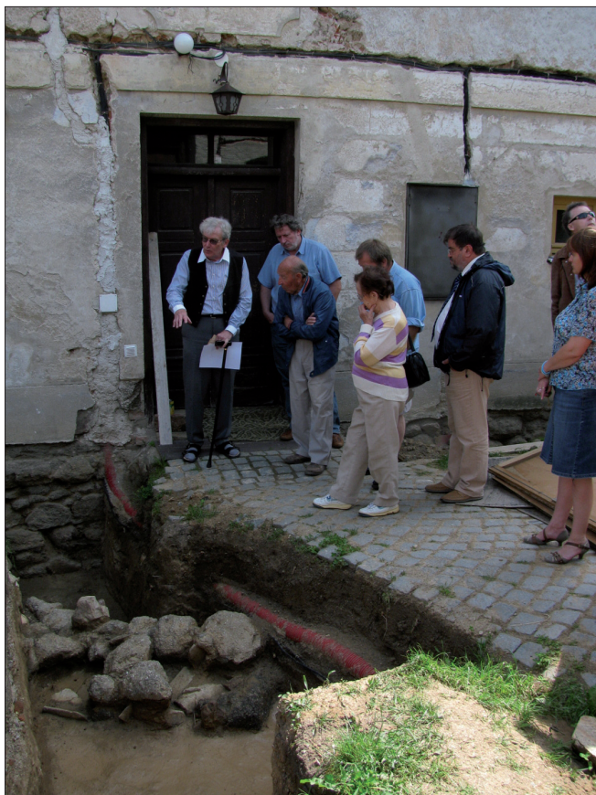
Obr. 6. Tasov. Účastníci odborné komise při prohlídce výzkumu.

kolem rotundy pohřbívalo, nebyla nejkratší. Vzhledem k závažnosti objevu pozůstatků rotundy starší než byl raně gotický kostel, byla na 9. června 2009 svolána odborná komise, jejímž úkolem bylo posoudit tento objev a navrhnout další postup