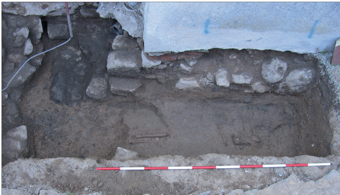
Obr. 4. Tasov. Severovýchodní nároží lodi kostela odkryté při archeologickém výzkumu.