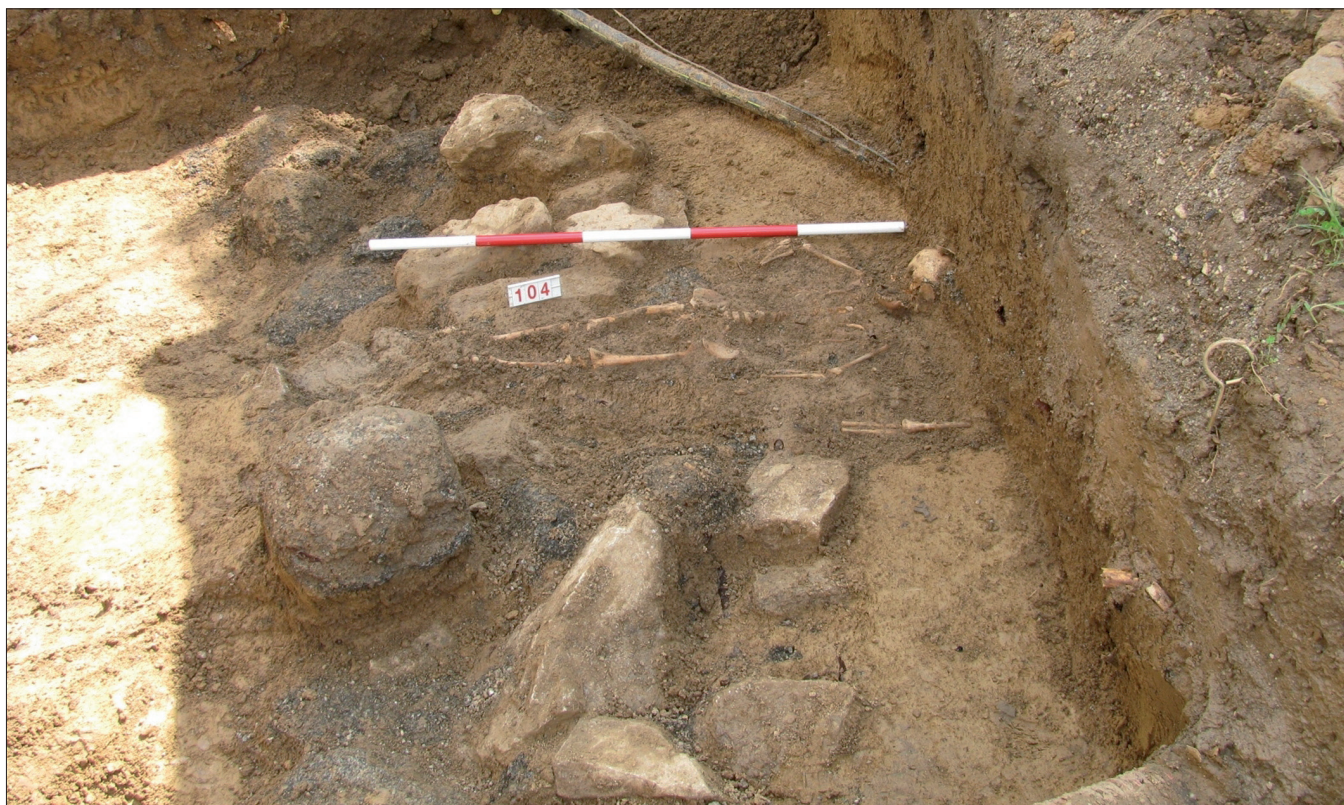
Obr. 8. Tasov. Hrob dítěte 104 překrývající zdivo rotundy.