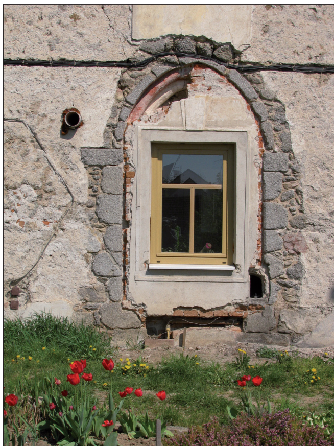
Obr. 2. Tasov. Zazděný a částečně odkrytý portál na jižní straně fary.