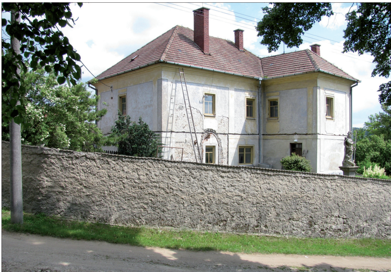
Obr. 1. Tasov. Fara od jihozápadu.