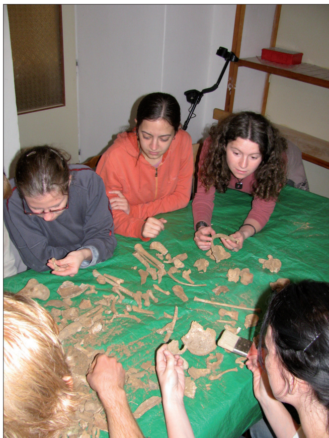
Obr. 11. Tasov. Studenti Ústavu antropologie Přírodovědecké fakulty Masarykovy univerzity při třídění antropologického materiálu.

pozornost z hlediska památkové ochrany, archeologie, dějin umění i historie. Poměrně hodně práce si vyžádá zpracování výsledků výzkumů, které by měly vyústit v kresebnou a modelovou rekonstrukci obou nově objevených kostelů a také v půdorysné vyznačení objeveného zdiva přímo v terénu. Značné úsilí bude třeba při zpracování lidských kostí a jejich zařazení do širších souvislostí. Další objevy lze očekávat při stavebních úpravách fary a okolí.