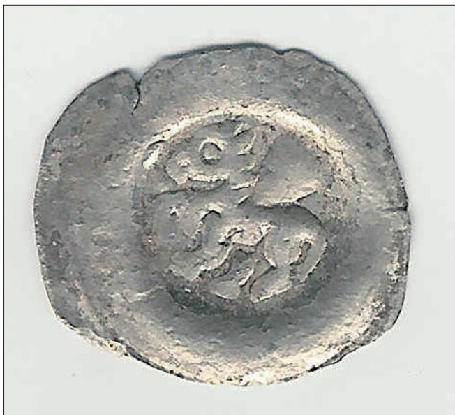
Obr. 5. Tasov. Brakteát Přemysla Otakara II. (1253–1278) nalezený v sondě na severní straně.