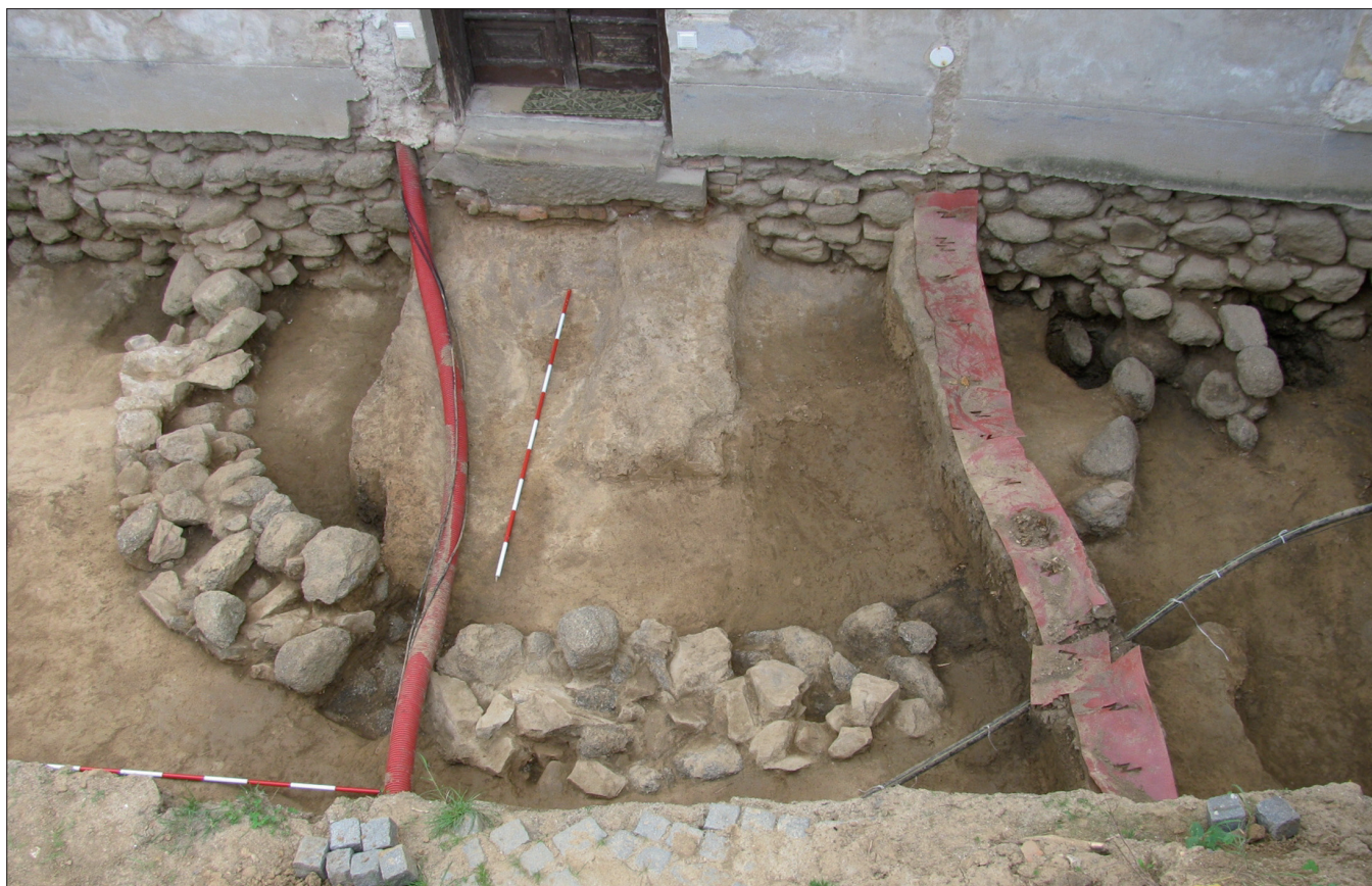
Obr. 7. Tasov. Část základů zdiva románské rotundy západně od fary.