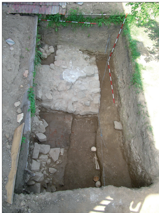
Obr. 3. Tasov. Jihovýchodní nároží kněžiště kostela odkryté při archeologickém výzkumu.