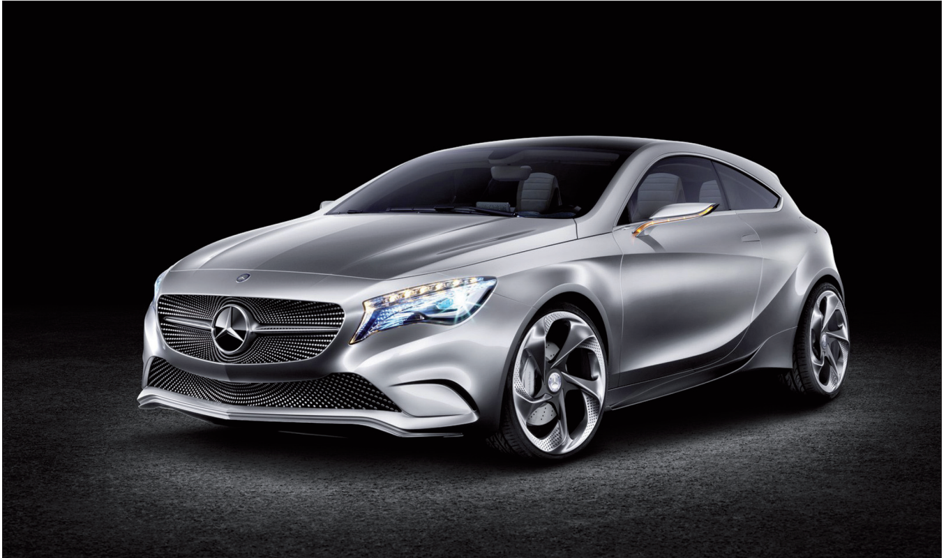
Obr. 5. Koncept Mercedesu-Benz A.

Postskriptum: V Číně mě provází Vaše skvělá kniha První císař: Tvůrce Číny a osmého divu světa ; chystám se nyní k návštěvě Muzea Prvního svrchovaného císaře v Lin-tchungu.