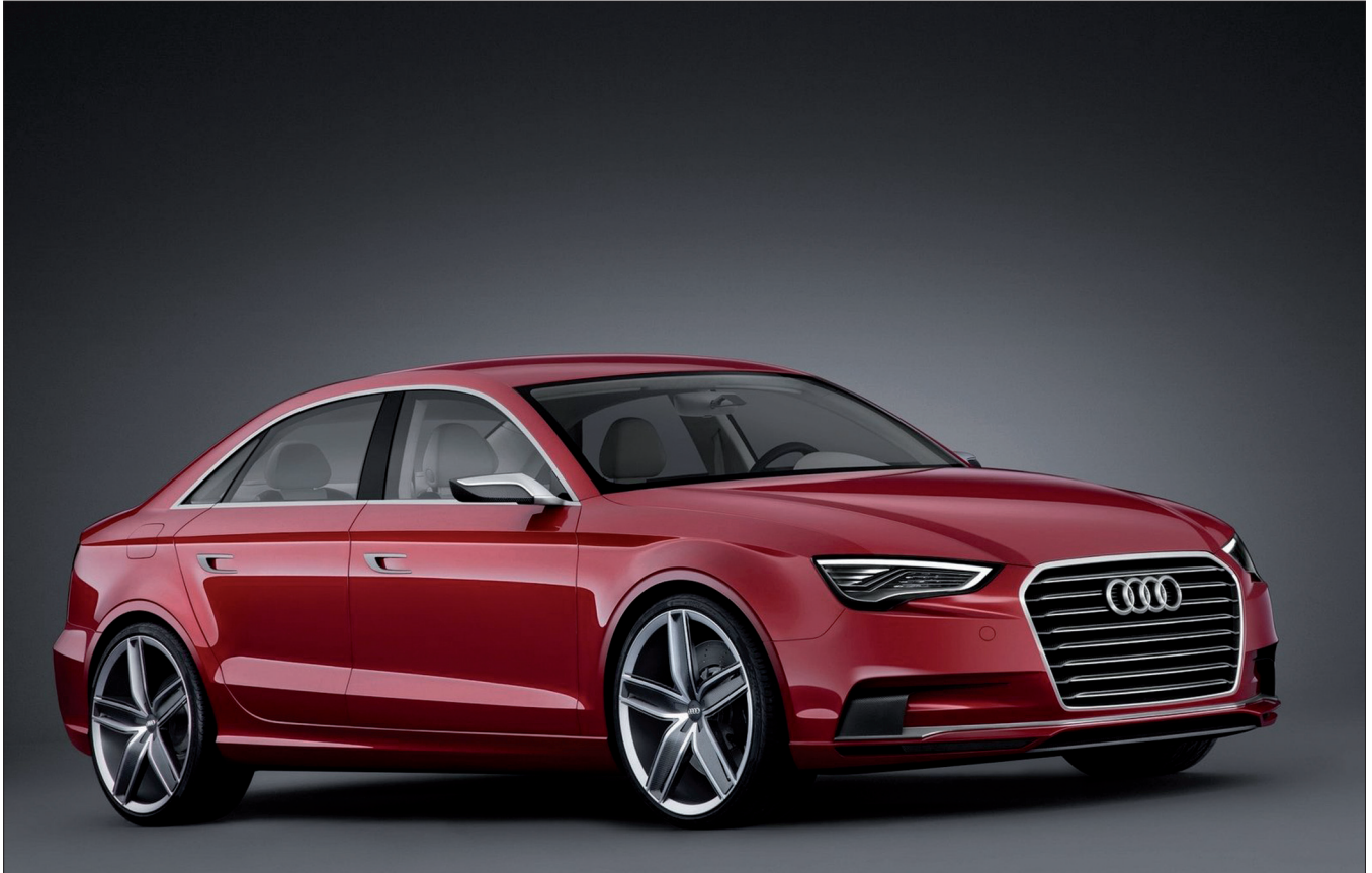
Obr. 3. Koncept Audi A3 . Netradiční pojetí tohoto čtyřdveřového notchback sedanu má karoserii dlouhou 4,44 m, širokou 1,84 m a 1,39 m vysokou. Koncept se stupňovitou záďí naznačuje možnosti pro další rozšíření modelů třídy A3 (včetně hatchbacku). K pohonu slouží přeplňovaný pětiválec 2,5 TFSI známý z modelů TT RS a RS 3 Sportback , který je naladěný na výkon 300 kW (408 HP). Maximální točivý moment 500 Nm je k dispozici od 1600 do 5300 min -1 . S motorem spolupracuje sedmistupňová dvouspojková převodovka S tronic a pohon všech kol. Maximální rychlost je elektronicky omezena na 250 km/h a zrychlení z 0 na 100 km/h zvládne A3 za 4,1 s (sic!). Výroba bude zahájena v roce 2012.

„Was bedeutet der Audi (insbesondere A3 Concept 2011 ) für Sie?“