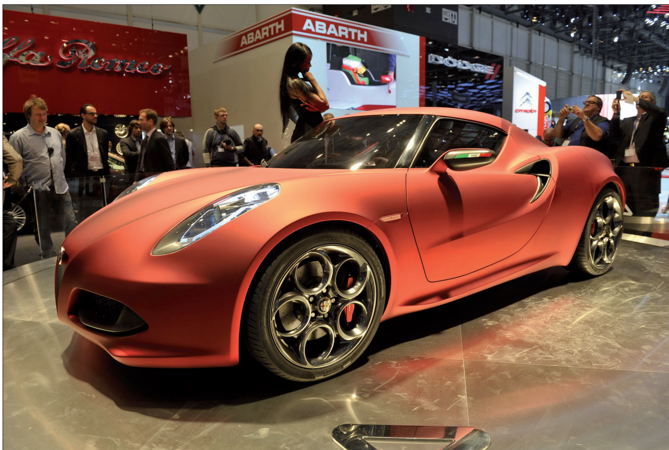
Obr. 4. Koncept Alfa Romeo 4C . Sportovní dvoumístné kupé má karoserii (v úchvatné přírodní kombinaci černé a červené barvy nazvané „červená láva“ – tak asi vypadala láva valící se z Vesuvu na Pompeje) dlouhou necelé 4 m a suchou hmotnost pouhých 850 kg (sic!). K pohonu slouží přeplňovaný čtyřválec s objemem 1,7 litru (výkon asi 230–250 HP). S motorem spolupracuje nová dvouspojková převodovka Alfa TCT a pohon zadních kol. Nejvyšší rychlost bude 250 km/h a zrychlení zvládne tato „lehko/rychlonohá alfička“ z 0 na 100 km/h pod 5 s (sic!). Výroba bude zahájena v roce 2012.

státech amerických pouze čtyři automobily, o třicet let později jich bylo v provozu přes dvaadvacet milionů. Z větší části je „vychrlily“ právě Fordovy běžící pásy. Laciné a spolehlivé auto Ford T v nejjednodušším provedení („můžete mít jakoukoli barvu, vyberete-li si černou“) za 260 dolarů (dělník u Forda tehdy pobíral 5 dolarů denní mzdy), láskyplně přezdívané Plechová Lízinka , triumfovalo. Užití montážní linky zahájilo hromadnou výrobu, která se stala základním hospodářským fenoménem světa 20. i 21. století.