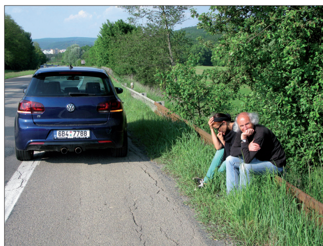
Obr. 2. Místo odebrání řidičského průkazu (alpská dálnice A12 [Inntalautobahn] v oblasti Innsbrucku) za výrazné překročení povolené rychlosti. Foto: Jan Filipšský (výtvarná redaktorka a fotografka byla v té chvíli indisponována).