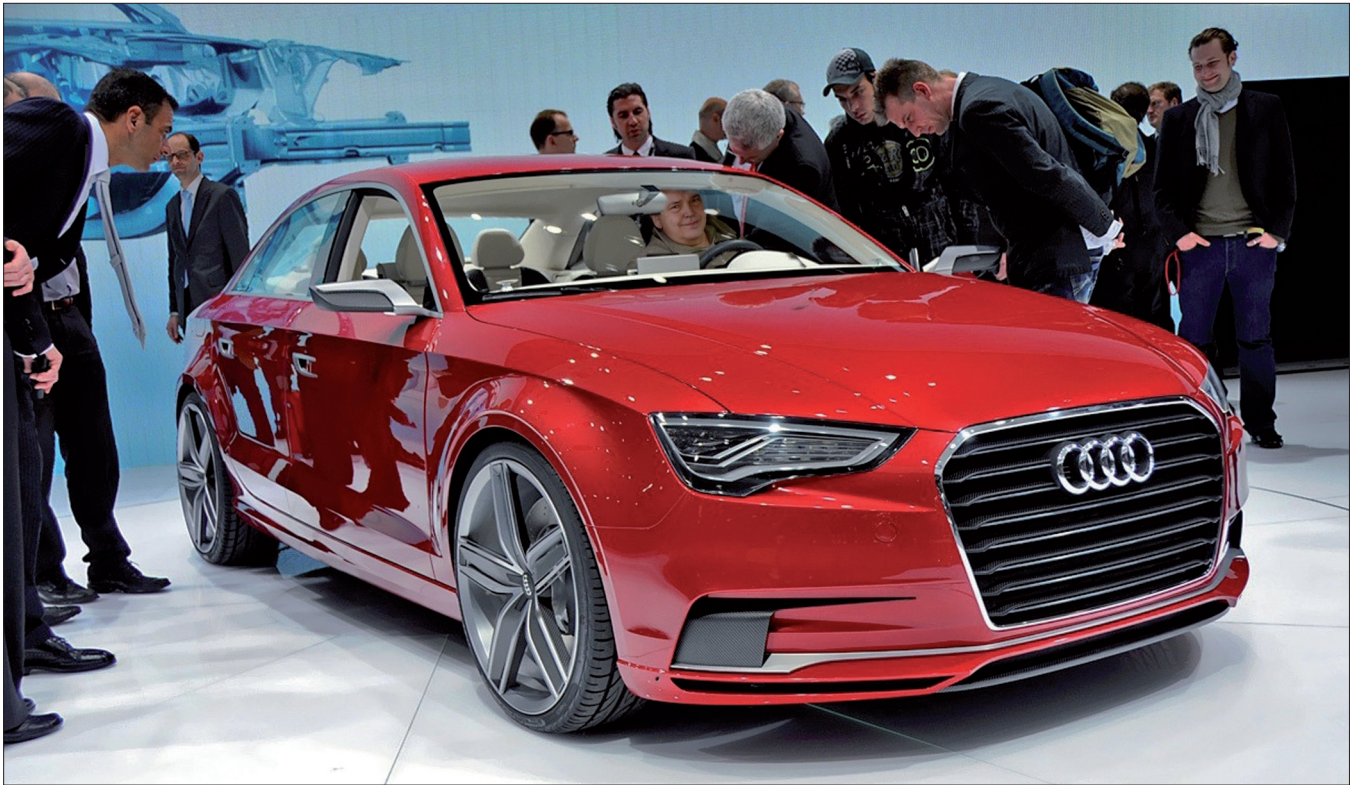
Obr. 6. 81. mezinárodní autosalon v Ženevě (březen 2011). V kabině konceptu Audi A3 Jan Filipický.

člověk (s přihlédnutím k dějinám literatury a umění). Brno: Akademické nakladatelství CERM, 37–46.