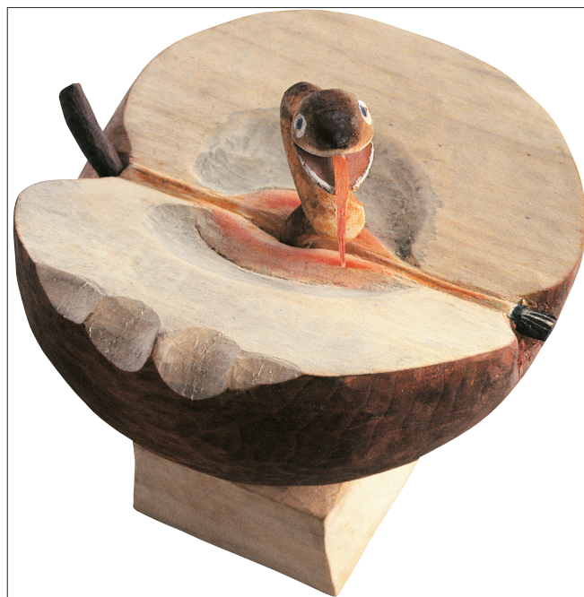
Obr. 6. Adamovo jablko IV , 2004, polychromovaný topol, výška 15 cm.

V roce 1971 přesídlil do Křížovic u Doubravníku, kde žije podnes. Tento rok znamená předěl v umělcově životě i tvorbě. Poloha Křížovic v kopcovitě krajině vysočinského podhůří, stranou hlavních cest je jak novým impulzem, tak potvrzením autorových starších uměleckých východisek. Příroda, která jej tu obklopuje, se stává trvalou součástí života i díla. Tak jako donedávna ztvárňoval svůj osobitý vjem italských měst, v němž se uplatňoval smysl pro monumentální členění hmot, tak se nyní v cyklu Křížovice upíná k drobnému mě-