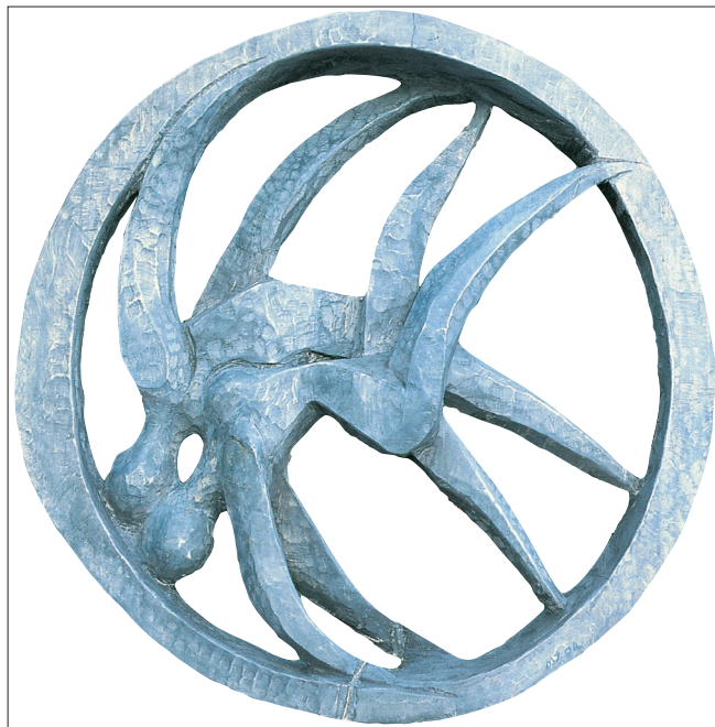
Obr. 4. Kruh prstenu , 2004, mořený topol, průměr 99 cm, výška (s podstavcem) 158 cm. Trojrozměrný emblém projektu Kruh prstenu .

V průběhu šedesátých let byla série Venuší vystřídána, či spíše paralelně provázána řadou prací zcela odlišných, nazvaných Světy ticha . K jejich vzniku přispěl objev, jemuž autor za mnohé vděčí, totiž zvláštní prostředí pod vodní hladinou, které jako potápěč důvěrně poznal. Světy ticha znamenají v umělcově tvorbě novou kvalitu. Zásadní proměnou je nejen přechod od figurální tematiky k novým, z přírody čerpaným a abstraktně ztvárněným motivům, ale opět i nové sochařské postupy. Hmota se stává vnějším obalem kolem vyhloubeného jádra. Bizarní, štíhlé protáhlé vertikální útvary tvoří kontrast k formě kulovité, spirálově stočené. Vnější schránka může být