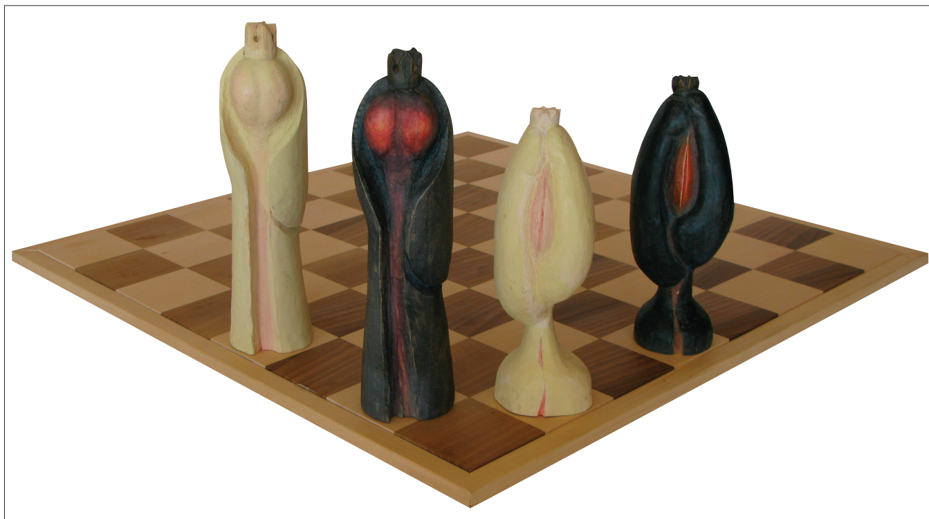
Obr. 18. Král a Dáma , z cyklu Erotické šachy , 2007–2008, polychromovaný topol, výška 33 cm, 27,5 cm. King and Queen , from the cycle Erotic chess , 2007–2008, polychromatic poplar, height 33 cm, 27.5 cm. König und Dame , vom Zyklus Erotisches Schach , 2007–2008, Pappel polychromiert, Höhe 33 cm, 27,5 cm.

deutendsten Schaffensetappen des Bildhauers gefüllt haben. In den Jahren 1964–1969 unternahm Macháček alljährlich Studienreisen nach Italien. Unter dem starken Eindruck italienischer Landschaften sowie historischer Städte entstand der Zyklus Italienische Städte . In ihm entwickelten sich besondere Objekte, die durch einen festen, mit verwachsenen kubischen Formen umgebenen Kern gekennzeichnet sind. Ohne irgendwelche Personifizierung oder Symbole anzudeuten, konnte der Künstler sein Wahrnehmen einzelner Städte – ihre Anordnung, Einbettung in der Landschaft – mit rein bildhauerischen Mitteln zum Ausdruck bringen. Um seine Eindrücke, Gefühle und Erkenntnisse darzustellen, entwickelte der Bildhauer eine eigene, den Zyklus als Gesamtheit prägende Formenlehre, wobei er jedoch Verschiedenheiten der Lokalitäten widerzuspiegeln vermochte. Im Prinzip handelt es sich um große, unregelmäßig bearbeitete Stämme, die mit kleineren Gebilden kontrastieren. Die im Zyklus Italienische Städte entwickelte Idee konnte der Autor in einer anderen Gestalt zur Geltung bringen, und zwar in einer neuen Etappe seines Lebens und Schaffens, zu deren Schauplatz das kleine Dörfchen Křížovice geworden war.