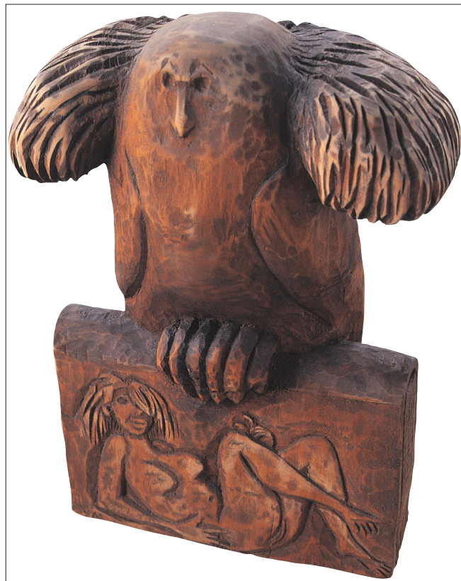
Obr. 12. Sova erotoman , 2003, mořený topol, výška 20 cm. The Owl-Erotomaniac , 2003, stained poplar, height 20 cm. Eule – die Erotomane , 2003, Pappel gebeizt, Höhe 20 cm.

In 1964–1969 he would go on study trips to Italy every year. The profound experience of the Italian landscape and its historical cities led to the cycle of specific objects Italian Cities consisting of the firm kernel surrounded by compound crystals of cubic forms. Without any indication of personification or symbols, there is a sculptural expression of the artist's perception of the character of the cities, their disposition and location in the landscape. For the expression of these impressions, feelings and perceptions, the author developed his own form-setting morphology which is common for the whole cycle of Italian Cities , but at the same time reflects the differences of various localities. In principle, they are big, irregularly rendered blocks contrasting with the minor forms. The artistic idea developed in the cycle of Italian Cities was also