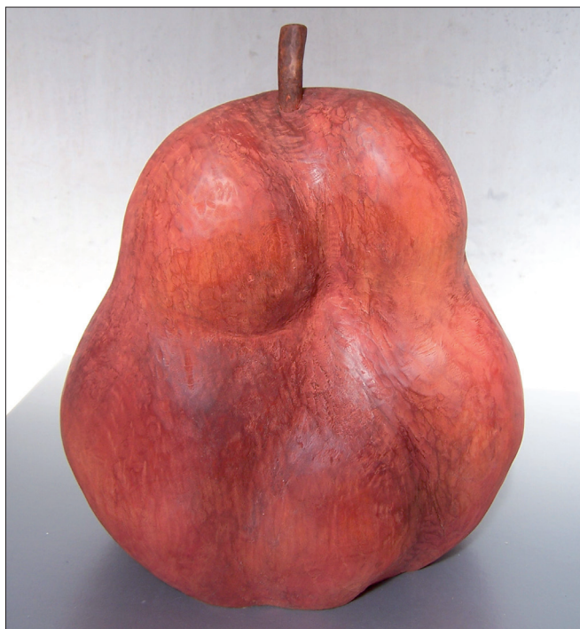
Obr. 7. Erotická hruška , 2006, mořená lípa, výška 25 cm.

Erotic Pear , 2006, stained linden, height 25 cm.