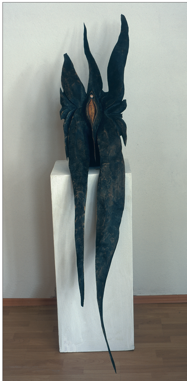
Obr. 8. Perla II , 1999, polychromovaný topol, délka 200 cm.

A Pearl II , 1999, polychromatic poplar, length 200 cm.