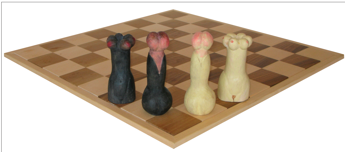
Obr. 19. Střelec a Věž , z cyklu Erotické šachy , 2007–2008, polychromovaný topol, výška 20 cm, 16,5 cm. Bishop and Rook , from the cycle Erotic chess , 2007–2008, polychromatic poplar, height 20 cm, 16,5 cm. Läufer und Turm , vom Zyklus Erotisches Schach , 2007–2008, Pappel polychromiert, Höhe 20 cm, 16,5 cm.

Parallel mit der Kleinplastik und den Plastiken von grundlegender Bedeutung schuf der Bildhauer seit Mitte der siebziger Jahre auch Serien von witzigen hölzernen Plastiken, meist mit Tiermotiven, für Kinderspielplätze: in Křížovice (1975–1976), in Blansko (1976), in Praha-Kunratice (1986) und in anderen Orten. Die Form der Plastiken ist meist durch eine minimal angepasste Form eines Holzblocks gegeben, der mit schmaleren Stämmen so ergänzt wird, dass die gewünschte Tierform deutlich hervortritt. Die Naturformen wurden womöglich erhalten, wobei die Oberfläche mit dekorativen Ritzen, Schnitzarbeiten und stellenweise auch mit Farbe belebt wird.