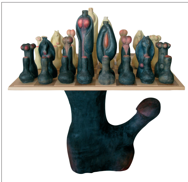
Obr. 16. Erotické šachy s Erotem , 2007–2008, polychromovaný topol (šachy), výška 12,5–33 cm, polychromovaný kaštan (Eros, podstavec I), výška 59 cm. Foto: Tomáš Mořkovský.

Erotic chess with Eros , 2007–2008, polychromatic poplar (chess), height 12.5–33 cm, polychromatic chestnut tree (Eros, pedestal I), height 59 cm. Foto: Tomáš Mořkovský.