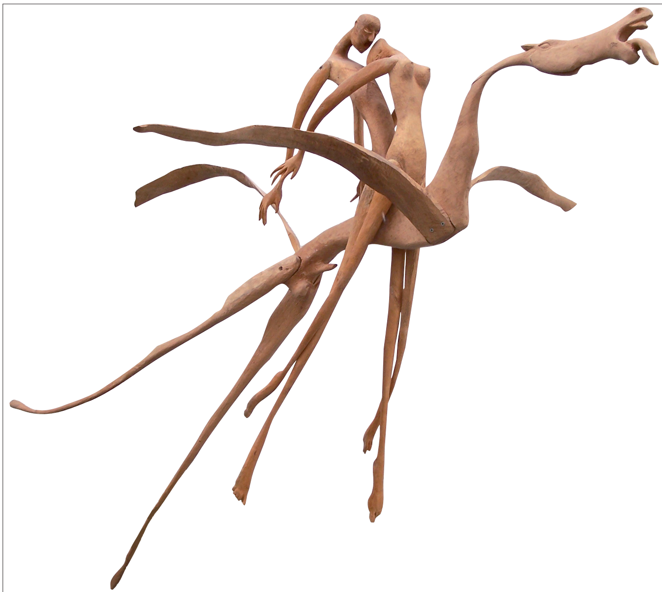
Obr. 14. Dva na koni II , 1999, topol, délka 188 cm, šířka 168 cm. Two on the Horseback II , 1999, poplar, length 188 cm, width 168 cm. Zwei auf dem Pferd II , 1999, Pappel, Länge 188 cm, Breite 168 cm.

plying the fragile forms of The Worlds of Silence . Like in his preceding creative stages, Macháček's works form the thematic cycles whose titles express the main subject and also reflect the poetic feature of the artist's perception. Not only the vision of huge natural pipes, but also the association with the verticality of a gothic cathedral space led him in the process of constructing objects called The Forest Cathedrals . Their height surpasses normal human scale many times over. Elements are set into their walls completing the image of a cathedral: a peripheral wooden plate, side openings as windows, glass fittings and antique glass panes.