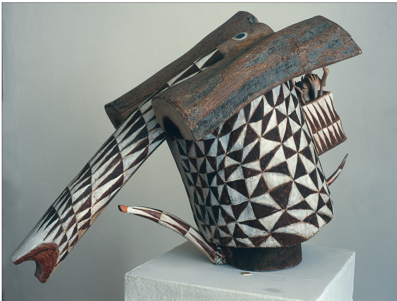
Obr. 15. Milování na slonu , 2000, jilm (slon), červená vrba (dvojice v nosítkách na hřbetě slona), výška 49 cm, šířka 63 cm. Making Love on the Elephant , 2000, elm tree (elephant), red willow (a couple in a sedan on the elephant's back), height 49 cm, width 63 cm. Liebespaar auf dem Elefanten , 2000, Rüster (Elefant), rote Weide (Liebespaar in der Trage auf dem Elefantenrücken), Höhe 49 cm, Breite 63 cm.

Mitte der fünfziger Jahre, anfangs jedoch im engen Kreis des Brünnner Kulturgeschehens als Bildhauer, in seinem künstlerischen Schicksal vom Material Holz entscheidend bestimmt. Unter Macháček's Arbeiten vom Ende der fünfziger und Anfang der sechziger Jahre steht an vorderster Stelle eine Serie von patinierten Klein-Holzschnitten mit Tiermotiven. Eines seiner Kennzeichen ist das immer wiederkehrende Stiermotiv, dessen fest geschlossene rundliche Form Elemente von Kraft und Dynamik in sich birgt. Die vereinfachte Form dieser Arbeiten verzichtet auf beschreibende Details und trotz kleiner Maße verrät sie Macháček's Sinn für Monumentalität. Die erwähnten Werke sind zweifellos von großem künstlerischem Wert, der im Vergleich zum Großteil der in den fünfziger Jahren üblichen Produktionen der tschechischen bildenden Kunst besonders auffällt. Sie beinhalten etliche Prinzipien oder deren Andeutungen, durch die dann auch das reife bildhauerische Werk des Künstlers in verschiedenen Schaffensperioden geprägt ist.