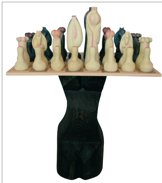
Obr. 17. Erotické šachy s Venuší , 2007–2008, polychromovaný topol (šachy), výška 12,5–33 cm, pálený smrk (Venuše, podstavec II), výška 65 cm.

Die entscheidende Veränderung lag nicht nur im Übergang von figuralen Themen zu neuen, aus der Natur schöpfenden, abstrakt dargestellten Motiven, sondern sie kam wiederum auch in einer neuen bildhauerischen Technik zum Ausdruck. Seine Arbeitsmaterie wurde die Hülle, die einen ausgehöhlten Kern umschloss. Bizarre, schlanke, lange vertikale Gebilde stehen im Kontrast zu solchen von kugel- und wendelförmiger Gestalt. Die äußere Schale kann auch als Käfig wahrgenommen werden, durch deren Lücken man in das Innere hineinblicken kann, wo sich ein weiteres Gebilde verbirgt. Auf solche Weise wird der Eindruck von zerbrechlichen Schalen erweckt, wozu ein stellenweise auf ein Minimum verdünnter Holzmantel beiträgt, der den inneren Raum zwar umgibt, zum Teil aber auch enthüllt. Das Oberflächenprofil einzelner Formen ist glatt und kontinuierlich, wie von Meereswellen poliert. In den Welten der Stille gipfelte das Schaffen Machá-