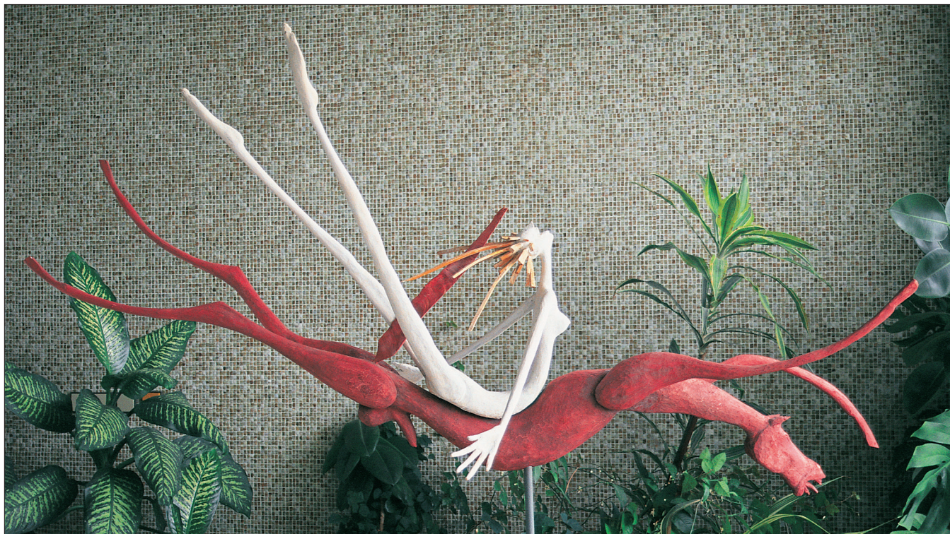
Obr. 10. Múza na červeném koni , 2004, polychromované dřevo, délka 200 cm.

A Muse on the Red Horse , 2004, polychromatic wood, length 200 cm.