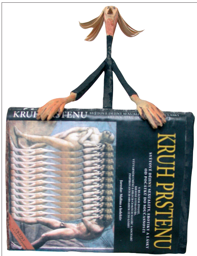
Obr. 5. Kruh prstenu pro JM , 2004, polychromovaná lípa, výška 21 cm.

A Cycle of a Ring for JM , 2004, polychromatic linden, height 21 cm.