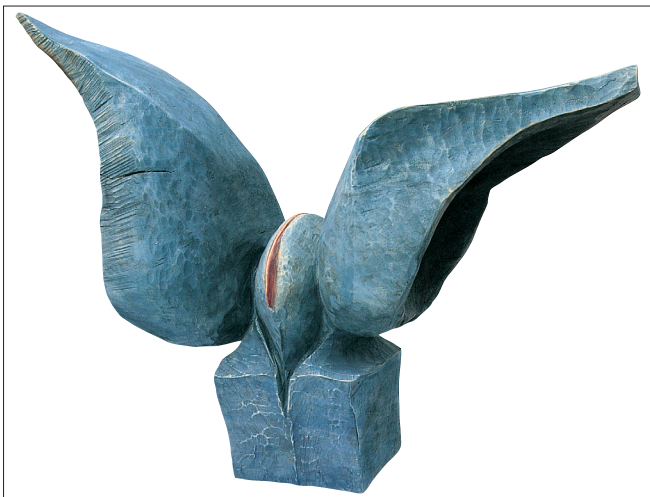
Obr. 11. Létající erotický objekt , 2004, mořený topol, výška 62 cm. Foto: Jitka Havlová.

A Flying Erotic Object , 2004, stained poplar, height 62 cm. Fliegendes erotisches Objekt , 2004, Pappel gebeizt, Höhe 62 cm.